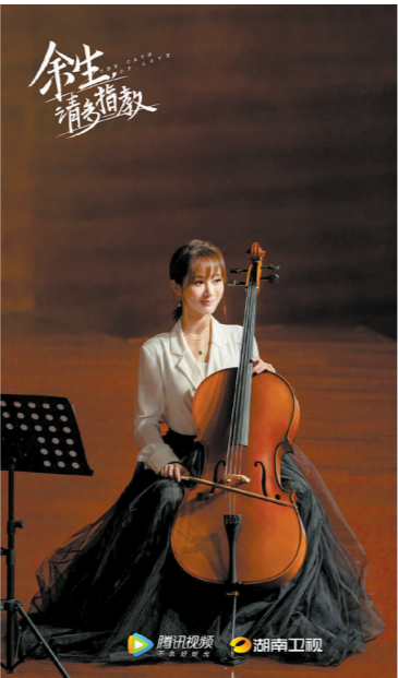
杨紫饰演大提琴手林之校