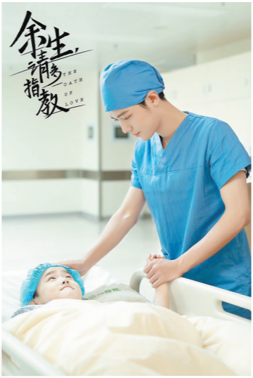
肖战饰演外科医生顾魏