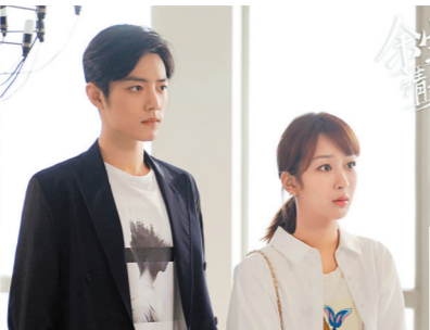
肖战杨紫都是高人气演员