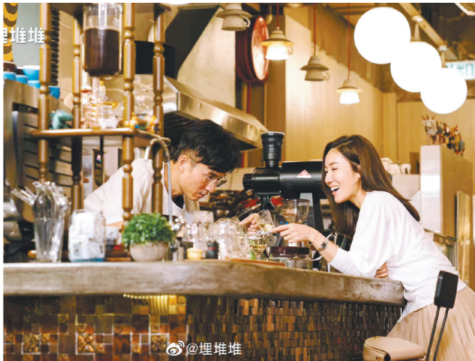
李施嬅和陈山聪饰演全新角色