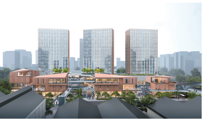
广州港太古仓复建区效果图

2008年开始,广州港集团对太古仓码头实施转型升级,使其成为广州最早进行转型升级的旧码头和旧仓库之一。当时广州港集团邀请了专门的文物修复单位及设计团队对太古仓码头进行改造,耗资数千万元历时四年,对作为历史保留工业建筑的3个丁字形码头、7座英式仓库以及外环境,以“修旧如旧”的方式进行外观修缮、结构加固和内部功能置换。