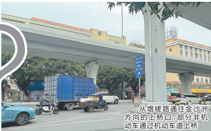
从增槎路通往金沙洲方向的上桥口,部分非机动车通过机动车道上桥

广州内环路进入金沙洲大桥的路口处,存在骑电动自行车的街坊和机动车抢道的现象。有市民表示,其中一个原因是供行人和电动自行车上桥的松贝街人行阶梯坡道窄且陡,市民推行电动自行车上桥十分困难所致。