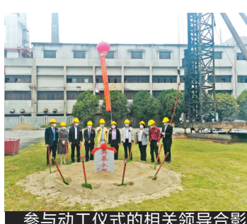
参与动工仪式的相关领导合影

广东开兰面粉有限公司是一家专业生产面粉的粮食深加工企业，位于广东省著名的侨乡——开平市三埠区的潭江河畔。厂区占地面积约33000多平方米，分别拥有两条国际先进的小麦专用粉加工生产线、2000吨泊位的专用码头，年加工能力120万吨，主要生产“开兰”“珠江”牌系列专用面粉，现有员工120人。开平嘉士利集团去年依法将其收购，谋划米面制品生产线及中央厨