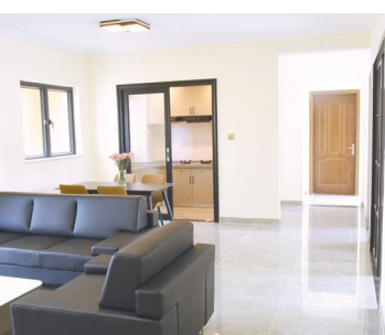
人才公寓可以拎包入住

下一阶段，三乡镇将继续着力通过配建、集中新建、政府与社会资本合作、购买、租赁市场房源、接管、盘活政府存量房源等多种方式筹集人才房源，在全镇不同片区推进人才房建设，方便人才工作出行，千方百计为人才解决“来有所居”的问题。