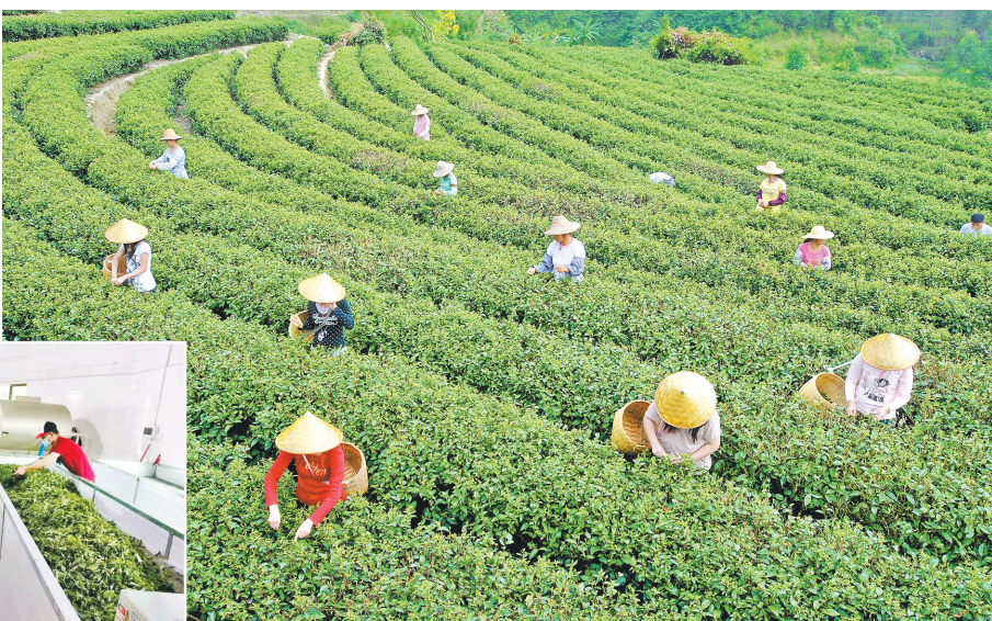
▲村民正在采摘春茶

茶叶品质与茶叶的采摘时间息息相关。目前鲜叶已进入采摘“黄金季”，由于疫情影响，出现了采茶工短缺的情况。针对这一情况，大沙镇农业办公室主任冯韶旭表示，该镇已采取相关措施积极应对，通过举办采茶技术培训、提高工资等措施吸引劳动力，并号召村民参与采茶和茶园管理工作，提高本土就业的同时也解决劳动力缺乏的问题。