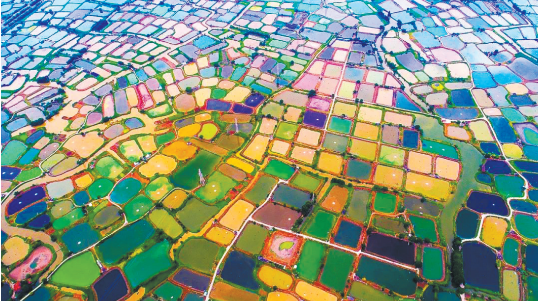
佛山渔业将迎来发展新机遇

假期期间，城管部门共出动执法人员611人次，处理游商乱摆卖、占道经营695宗，清理乱贴乱挂广告现象173宗，规范共享单车停放秩序330车次，加强市容环境秩序的管理。