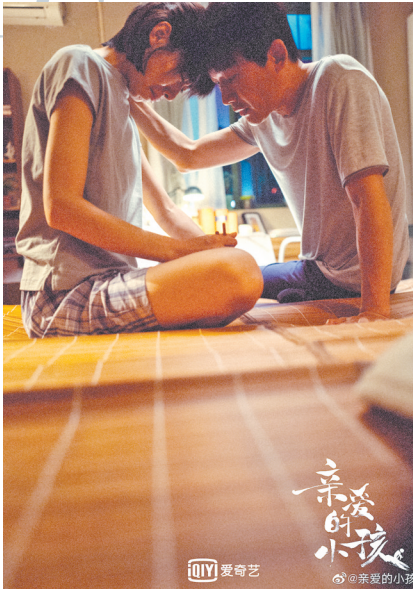
再组家庭面临伦理危机