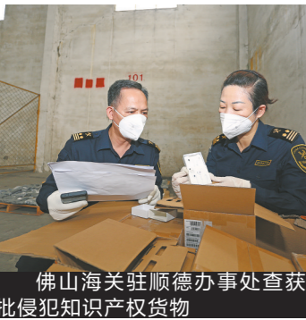
佛山海关驻顺德办事处查获一批侵犯知识产权货物

羊城晚报讯 记者欧阳志强、通讯员关顺摄影报道：近日，佛山海关驻顺德办事处在出口货运渠道查获涉嫌侵犯知识产权商品217件。 此前，佛山某公司以市场采购方式向佛山海关驻顺德办事处申报出口一批货物。现场海关对该批申报为“玩具”的货物进行检查时发现，该批货物内有内外包装均印有“苹果”商标的电子产品，经清点涉及耳机210副、手机7台；且相关产品外包装做工粗糙，现场海关初步判断存在涉嫌侵权行为。