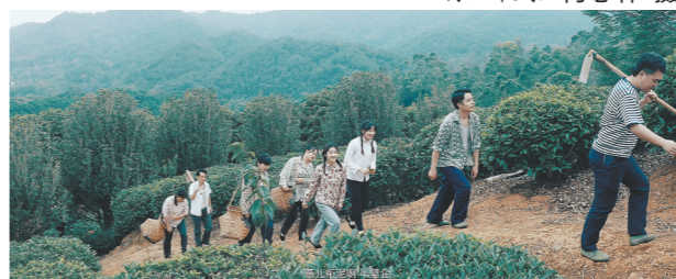
《围屋喜事》剧照