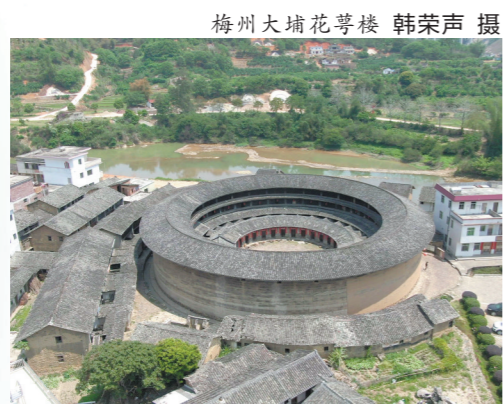
梅州大埔花萼楼

中负责理事的、有一定声望地位的老年男性。再如客家话中，将“耳朵”称为“耳公”，“鼻子”称为“鼻公”，舌头却称为“舌嫲”，生姜称为“姜嫲”，这是客家方言的另一个特点：带有较多的有性名词，这在一定程度上反映了在农耕时代客家人“男耕女织”“男外女内”的传统格局。自明清以来，不少客家人过“番”谋生，留下了不少“等郎妹”，也给客家方言带来了一些外来借词，如“洋油”“红毛泥”，甚至外语音译语，如“罗蒂糕”等。