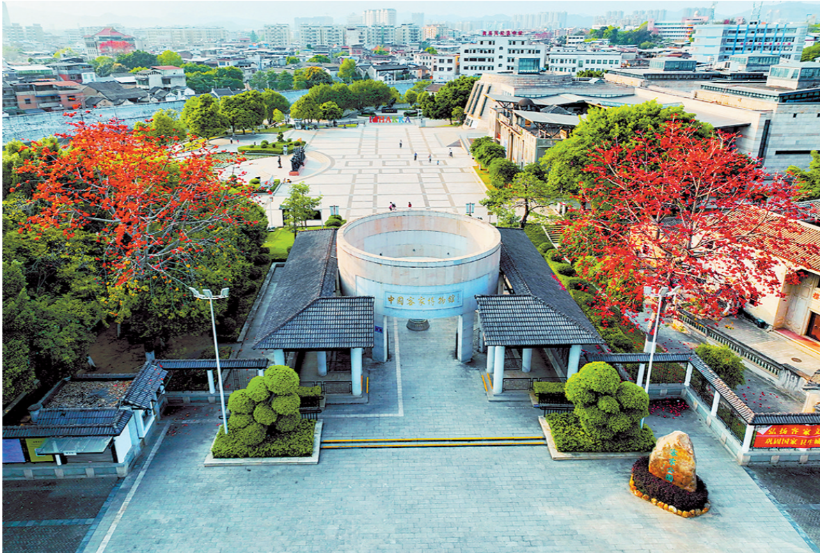
中国客家博物馆 何志林 摄

4月23日，第31届世界客属恳亲大会主题曲《天下客家》在梅州开拍并将于今年6月全球首发。客家山歌剧《白鹭村》《春闹》获广东省艺术节剧目一等奖。客语流行歌曲《莫欺少年穷》火遍全网。客语电影《围屋喜事》在全国上映并获评年度广东优秀电影作品……连日来，羊城晚报记者采访了解到，以客家方言为载体的客家山歌剧、客语流行音乐、客语情景剧、电影及微电影近年佳作频出、热搜不断，古老方言正以多种形式焕发出新活力，也走向更广阔的天地。