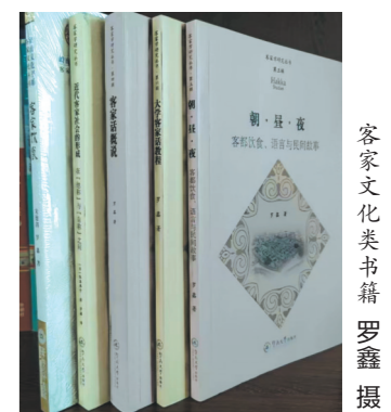
客家文化类书籍

大多数研究客家思想文化的学者都指出客家人传承了深厚的中原文化，中华民族传统的思想，如提倡“真善美”、讽刺“假恶丑”的思想在客家熟语中也得到反映。如“你有春风，我有夏雨”（投桃报李，礼尚往来）“只爱人情好，食水也安甜”（交往重在情谊，而非吃喝）“食水爱念水源头”（饮水思源）“乌心萝卜白面皮”（金玉其外，败絮其中）“狐狸花猫”（比喻说谎、造谣）“人话蛇，唔疏蛇”（比喻人云亦云，毫无主见）“安耳斗柄”（比喻胡编乱造）等。