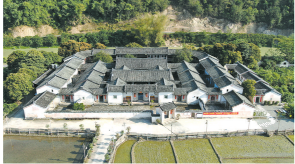
梅州大埔张弼士故居