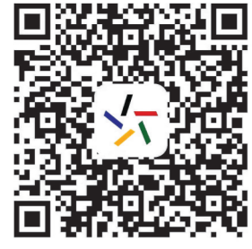
广东体彩网点征召平台