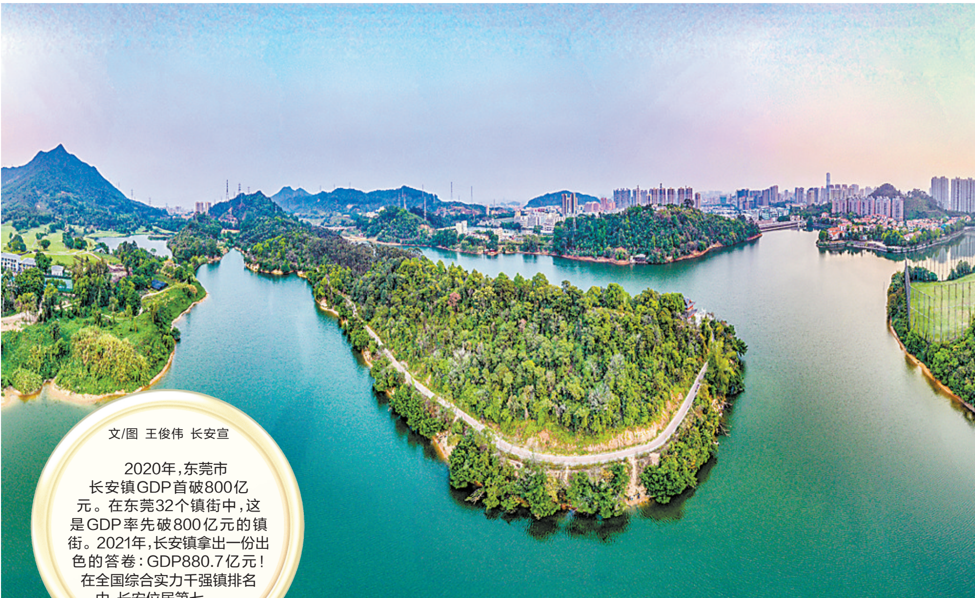
▲目前长安“绿道之城”建设已串联62.3公里绿道

河等7条河涌清淤23.66万立方米，长青渠、人民涌等4条黑臭水体整改达标，茅洲河沿岸9个主题景观公园基本完工，茅洲河共和村国考断面水质稳定达标Ⅴ类水，获得广东省生态环境厅通报表扬，对全省打好打赢水污染防治攻坚战作出积极贡献。 伴随着茅洲河流域水质提升，长安镇开始享受到生态助力地方高质量发展的红利：茅洲河生态经济长廊呼之欲出，“绿道之城”建设更是把治水与治产、治城进一步融合，为推动全镇经济社会高质量发展厚植基础。 据长安镇政府介绍，伴随着茅洲河流域环境改善，临河区域板块发展迅猛，一批高新科技产业和上市企业相继入驻，茅洲河岸开始成为长安经济发展的“新引擎”。 长安“绿道之城”建设是继“治水”之后又一重大工程，既满足人民群众对美好生活向往追求，也满足长安镇高质量发展的城市品质和环境要求。 2020年6月，长安正式启动“绿道之城”规划建设部署，围绕“拨草现珠，串珠成链，多链成环，环环相扣，扣扣相通，通山达海”的理念，打造集山海河湖林田于一身的长安“绿道之城”。