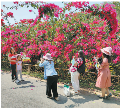
▲市民在盛开的筋杜鹃下留影