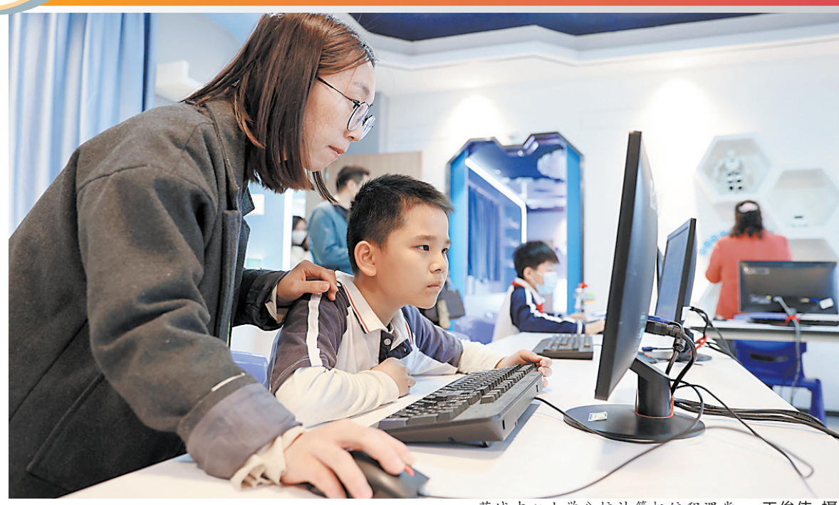
莞城中心小学分校计算机编程课堂

教育是国之大计，更是民生之基。“十四五”时期，我国教育进入高质量发展阶段。今年以来，东莞市教育系统坚持稳中求进工作总基调，落实立德树人根本任务，聚焦“学有优教”发展目标，深化基础教育综合改革，从全力推进“双减”落实攻坚战，到全力推动“公办扩容、民办提质”，全力打造“莞邑良师”队伍，在深化“集团化办学”等多方面、多路径跑出东莞“双万”新起点上教育发展“加速度”。