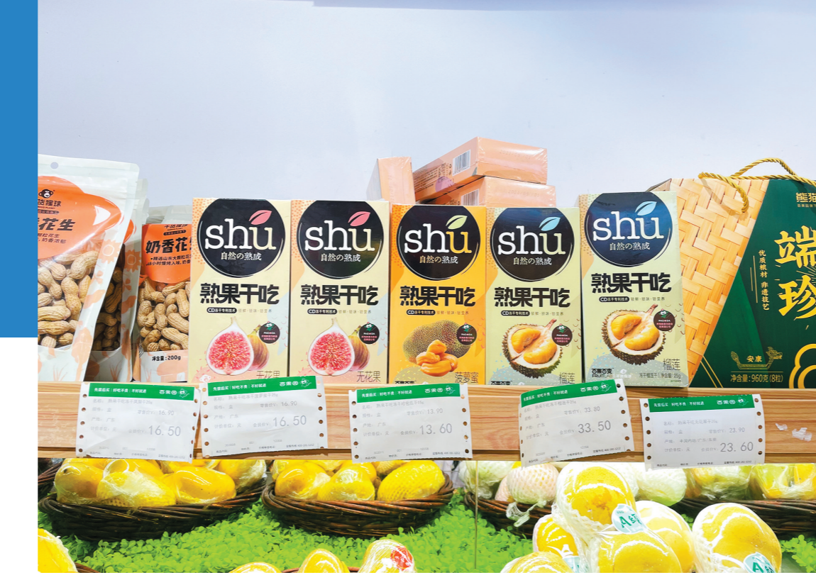
百果园货架上销售坚果品牌和生鲜品牌的产品

实现营业总收入36.05亿元，同比增长53.6%；实现净利润5.84亿元，同比增长2.6%；每股收益为0.16元。