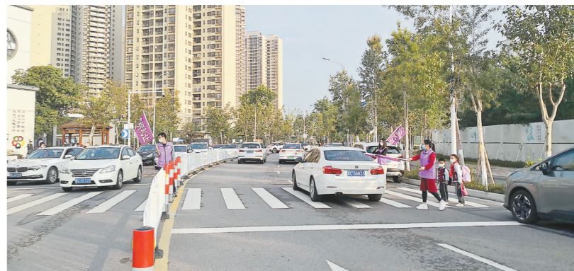
云峰小学门口改造后