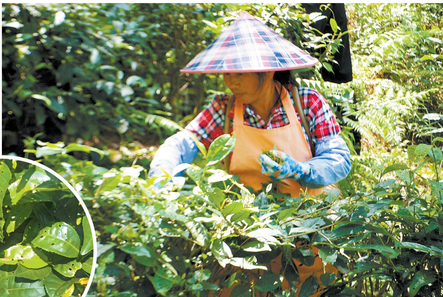
被绿叶蝉咬过的茶叶上布满了洞