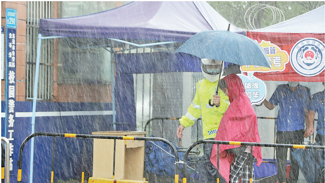
公安部门为考生撑起“平安伞”