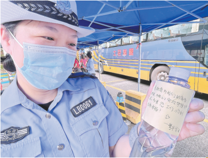
执勤交警收到考生暖心“小纸条”