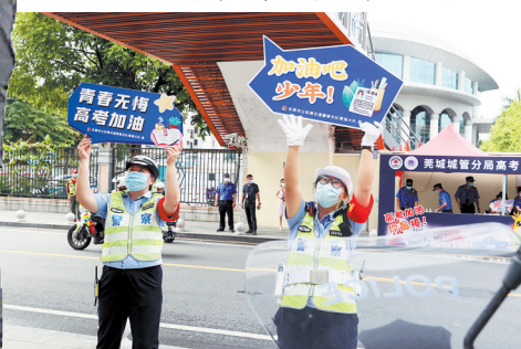
民警高举标示牌，为即将进入考场的考生加油

十年磨剑，今朝试锋，2022年全国普通高考6月7日如约而至。开考首日，东莞31100余名学子奔赴20个考点、1080个考场。考场内，考生全力以赴，为青春梦想而战；考场外，家长深情陪伴，公安城管温暖守护……“平安高考”“暖心高考”“温馨高考”“公正高考”的背后，无数人默默参与。