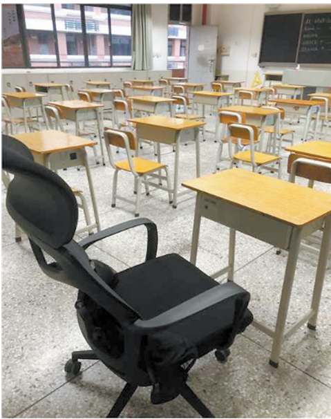
考点为考生准备的专用座椅