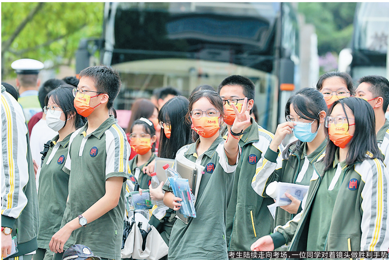
考生陆续走向考场，一位同学对着镜头做胜利手势

6月11日至12日两天，粤港澳（东莞）非遗墟市还将邀约50个优质非遗项目现场展销，其中包括新入选的21个市级非遗项目，市民能够在现场品尝、体验非遗产品，现场还设置了礼品兑换区，在城市消费满一定额度即可凭付款记录换取礼品。