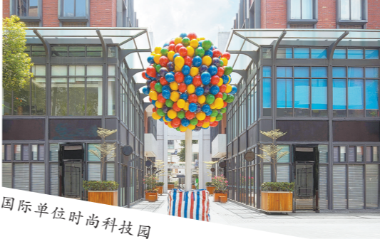
国际单位时尚科技园

美好个案 老旧皮鞋厂,变身国家级科技企业孵化器 在黄石立交附近的国际单位时尚科技园内,有一个新兴的电商直播基地,直播电商国内龙头企业辛选集团为代表的一批直播电商上下游企业就崛起于此,这个已有十几年历史的产业园区,正在迸发全新的力量。 国际单位时尚科技园前身为国营厂长征皮鞋厂以及村级工业园马务联和工业区,厂房老旧,环境杂乱。时代商业邀请了亚洲设计大师万谷建志、林伟而、谷腾等对其进行整体规划和建筑设计,没有进行大拆大建,而是