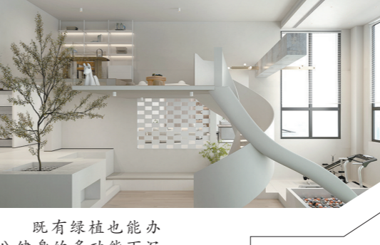
打通各房间增强互动的户型设计