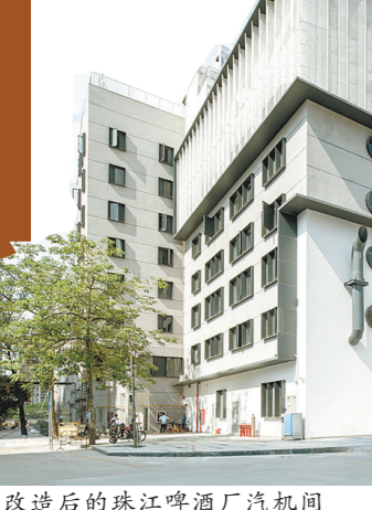
改造后的珠江啤酒厂汽机间

去年9月26日,广州市住房和城乡建设局印发了《广州市旧厂房“工改工”类微改造项目实施指引》(下称《指引》)。《指引》明确了旧厂房“工改工”类微改造项目实施改造的具体操作流程。 “以前的旧厂改造大家讲的是简单的“腾笼换鸟”,现在更多讲究的是有机更新,是城市综合容量的提升。” 竖梁社高级设计合伙人朱志远说。 在他看来,十年前的旧厂更新和如今对比已发生了巨大的变化:以前的三旧改造时期,大家注重的是简单的建筑容量的提升,多为拆掉旧低矮建筑,建造高一点的园区;后来是功能的升级,即腾笼换鸟。 现在则强调有机更新,旧厂改造的同时是城市综合容量的提升与产业布局的升级,更是生态环境的改善、居民社区的共建、城市风貌的打造、历史文化社区的维护。“整个改造过程被寄予更多任务,这使现在的旧厂更新大潮的综合维度高、广度大,难度也更大。”