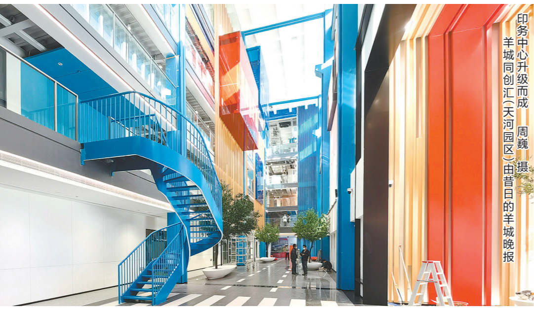
印务中心升级而成 羊城同创汇(天河河区)由昔日的羊城晚报

今年4月,在上海居家隔离的演员刘畊宏火遍全网,他与妻子的健身直播受到广大网友的热捧,一时间,“刘畊宏女孩”“刘畊宏男孩”成为了居家健身的代名词。 其实,不仅居家健身,在当今社会各种因素的影响下,各类居家活动也越来越普遍。例如,居家办公与上网课的结合,使得“边上班边带娃”已是多个家庭在特殊时期的真实写照。学习、工作与生活的密不可分,共处时间的增多都难免会产生家人之间意见、观点上的碰撞,人与居住的关系讨论也被推至更深层次的维度。 人因宅而立,宅因人得存。以人为本的室内设计如何顺应居家活动产生的需求?本期《人居大咖谈》,二位资深室内设计师向羊城晚报记者分享住宅布局设计与家庭关系维护等方面的从业心得及生活体会。