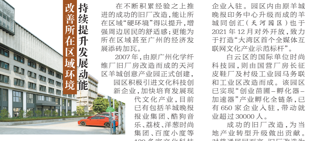
国际单位时尚科技园

在不断积累经验之上推进的成功的旧厂改造,能让所在区域“硬环境”得以提升,增强周边居民的舒适度;更能为所在区域甚至广州的经济发展添砖加瓦。 2007年,由原广州化学纤维厂旧厂房改造而成的天河区羊城创意产业园正式创建,园区积极引进文化科技型企业,加快培育发展现代文化产业,目前已有包括羊城晚报报业集团、酷狗音乐、荔枝、洋葱时尚集团、百度小度等130多家文化科技企业入驻。 园区内由原羊城晚报印务中心升级而成的羊城同创汇(天河河区)也于2021年12月对外开放,致力于打造“大湾区首个全媒体互联网文化产业示范标杆”。 白云区的国际单位时尚科技园,则由国营厂厂长征皮鞋厂及村级工业园马务联和工业区改造而成。该园区已实现“创业苗圃-孵化器-加速器”产业孵化全链条,已有650家企业入驻,带动就业超过30000人。 成功的旧厂改造,为当地产业转型升级做出贡献。对普通居民而言,旧厂改造为