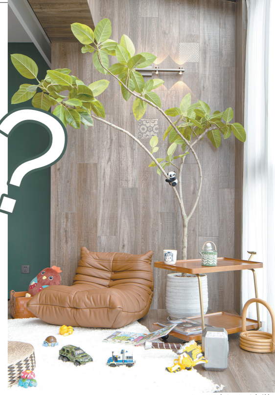
通过不同家具的摆设发挥不同功能的空间