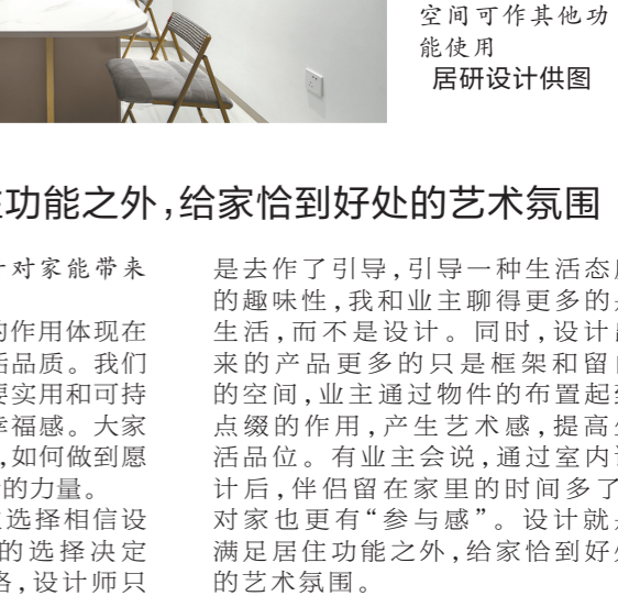
餐桌折叠后空间可作其他功能使用