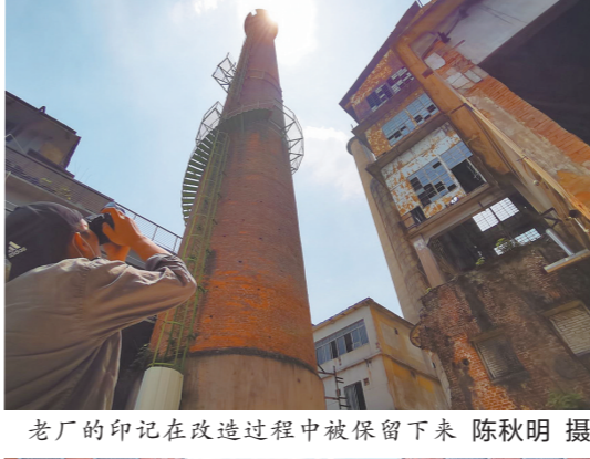
老厂的印记在改造过程中被保留下来