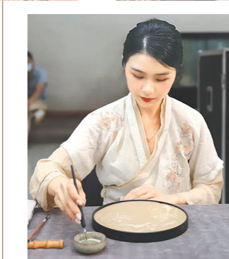
▲▲近期惠州举办宋式点茶雅集活动,图为“水丹青”展演