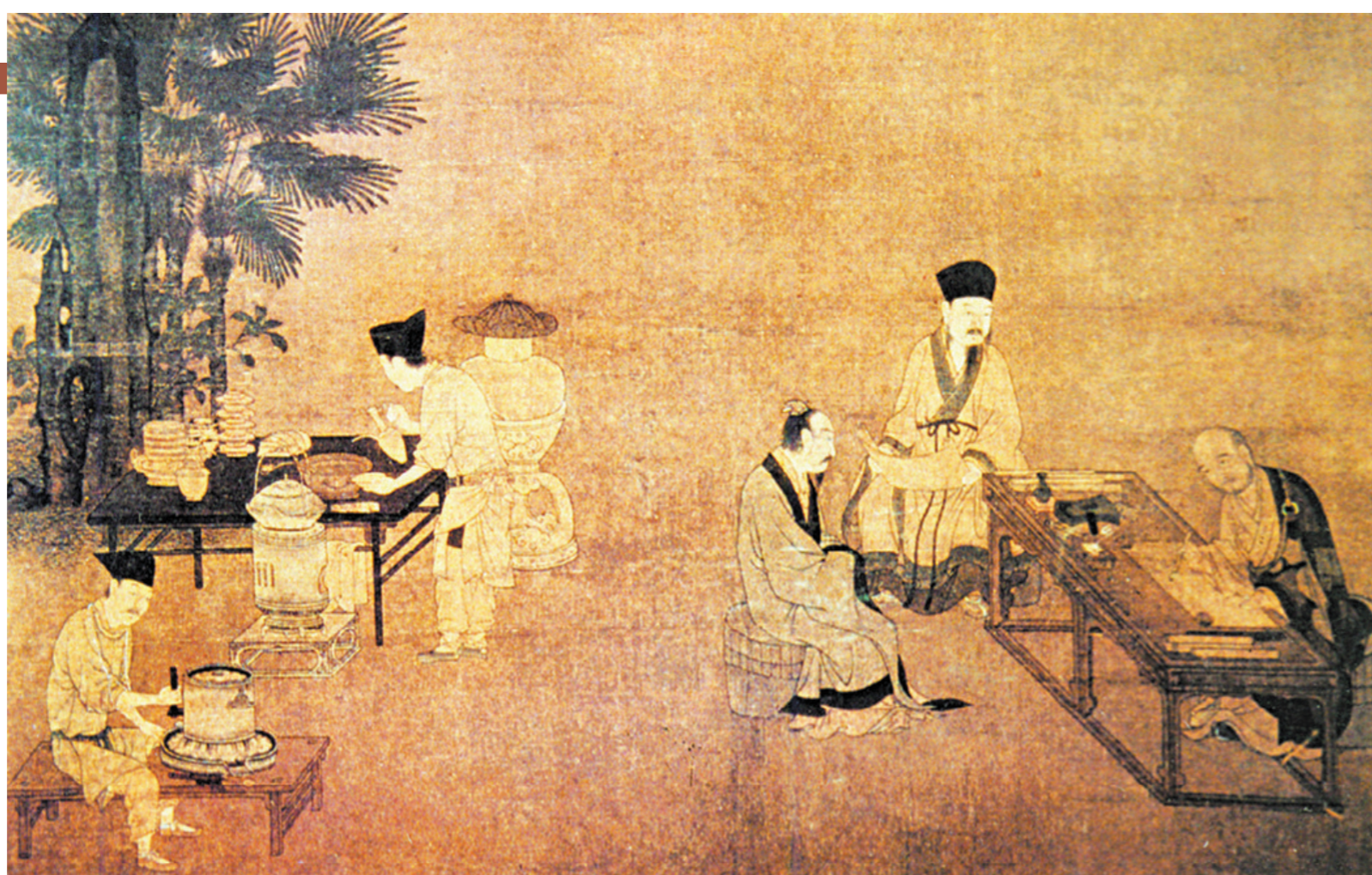
南宋刘松年《撵茶图》(翻拍)

近来,古装连续剧《梦华录》热播,再现了历史上宋朝茶文化兴盛的社会面貌,各大社交平台上关于“宋式点茶”讨论热度不减。刘亦菲饰演的赵盼儿茶艺精湛,让人印象深刻,剧中的“斗茶”情节更是推动中国古代茶文化出圈。