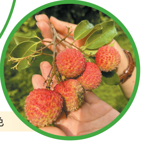
▲游客展示采摘的新鲜荔枝 ▲游客在山湖荔生态农场自助采摘成熟的荔枝

为了让市民在荔枝成熟季大饱口福，近期东莞市农业农村局还推出荔枝主题精品线路和莞荔休闲采摘点，邀市民品荔枝、游乡村。