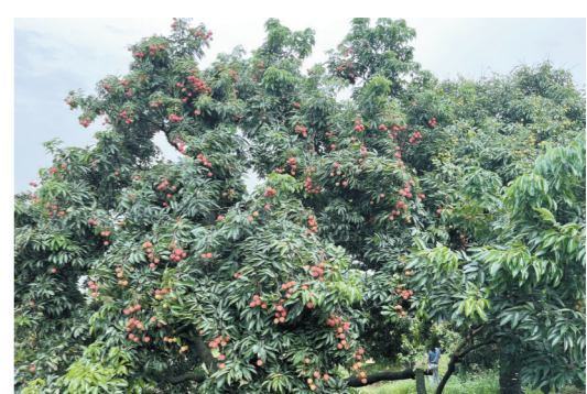
山湖荔生态农场的糯米糍荔枝成熟了

爱情斑马线等。“厚街游”路线途经大迳汪潭党史公园、荔枝采摘点、大岭山森林公园湾区自然学校、大湾区横岗湖研学教育实践营地，该线路的主题是“红色革命路，绿色大迳行”，把红色人文景观与绿色自然景观结合起来。在观光的同时，游客有机会品尝到独特的厚街“冰荔”。“塘厦游”路线除了经过塘厦远昌果场之外，还纳入了新苑农庄、大屏嶂森林公园等，区别于一般的荔枝种植园，其依托大屏嶂森林公园的优势，打造荔枝林下旅游的特色名片。而“企石游”路线依托一湖两河两岸四脉的区域优势，让游客在采摘荔枝的同时领略江边古村落、东清湖市级湿地公园美景。