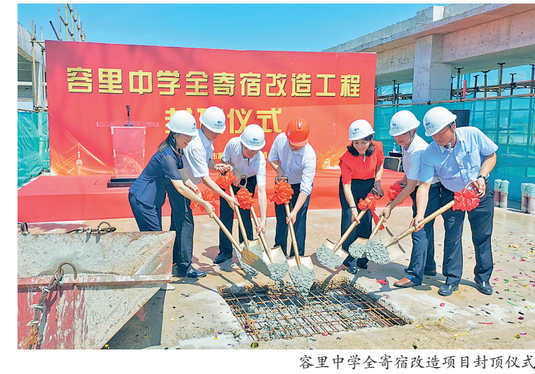
容里中学全寄宿改造项目封顶仪式

未来，容桂街道还将继续推进容里中学教学楼、学生宿舍和饭堂、塑胶跑道运动场的改扩建，为广大学生提供更优美完善的学习生活环境。