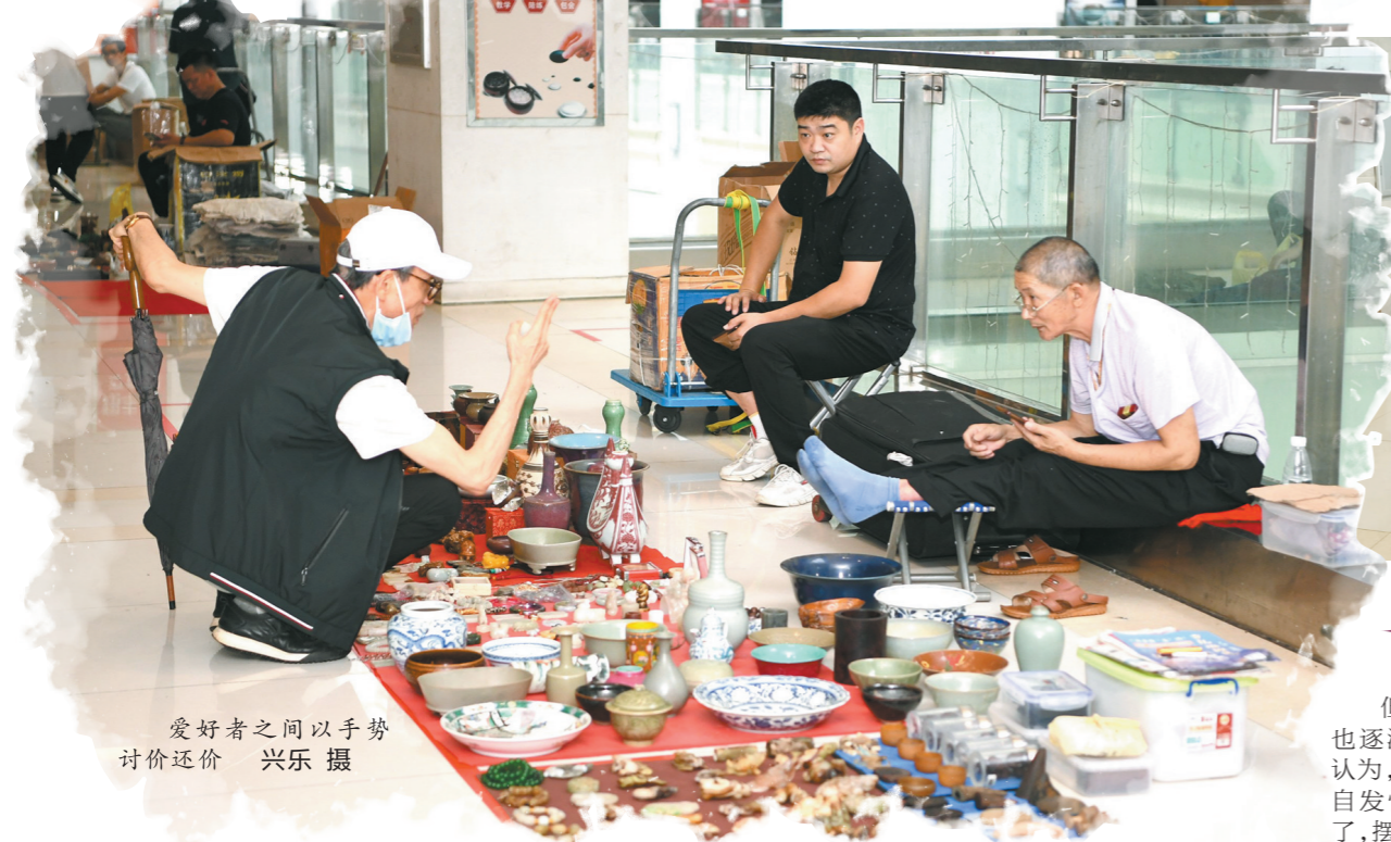
爱好者之间以手势讨价还价