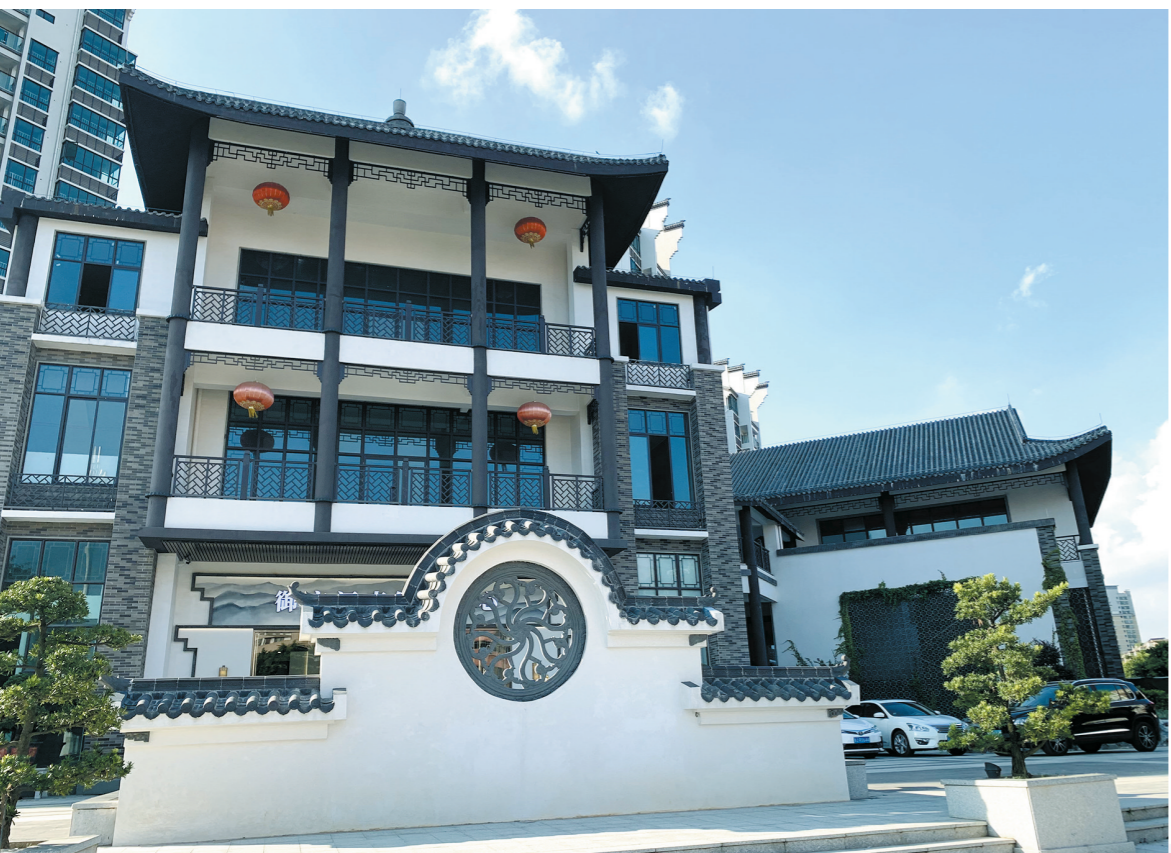
规划中的古玩城所在地

20世纪初，海外侨汇的大量流入让江门五邑涌现出大量富足之家，收藏各类古玩成了他们展示财富和文化底蕴的方式，这让大量古玩藏于五邑民间。20世纪80年代至90年代，市场经济的兴起让江门的古玩交易日渐兴旺。但随着珠三角各地的古玩交易陆续发展，江门反而沉寂下来。“先行者”如何复兴？打造规模化、规范化的古玩集聚地，经营上突出华侨文化特色，成了业内人士的共识。