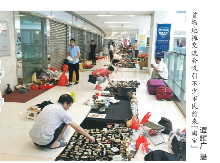
首场地摊交流会吸引不少市民前来“淘宝”