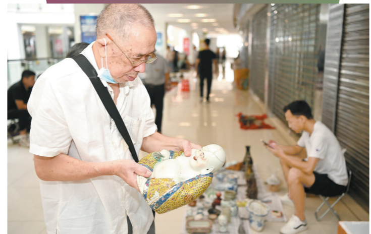
不少市民觉得心头好

面对日渐沉寂的江门古玩市场，业内人士各有思考。但他们大都认为，要复兴，必须要打造规模化、规范化的古玩集聚地。