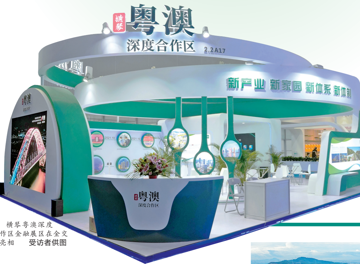
横琴粤澳深度合作区金融展区在全交会亮相 受访者供图

日前,第十一届中国(广州)国际金融交易·博览会在广州琶洲会展中心开幕。横琴粤澳深度合作区金融展区以“新产业,新家园,新体系,新体制”为主题在本届金交会亮相,备受瞩目。