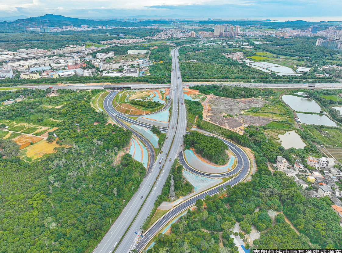
南朗快线中顺互通建成通车