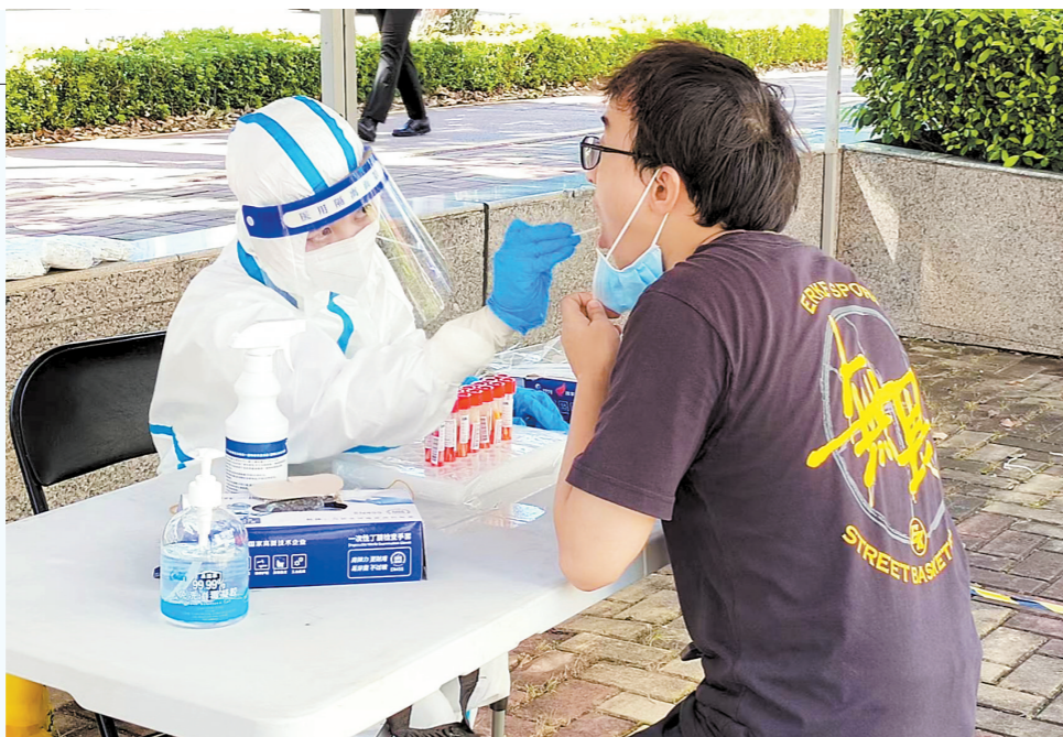
柠溪加油站附近核酸检测点,市民接受核酸检测

据介绍,珠海市已对上述病例涉及的所有密切接触者及次密切接触者进行了全面的排查,并按要求落实管控和健康监测措施,所涉及的场所进行管控并落实消毒措施。