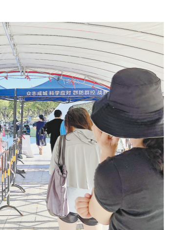
市民有序排队进行核酸检测

目前,珠海市新增的3例新冠肺炎确诊病例均为同一幼儿园同班的工作人员,均已收入中大五院隔离治疗,经专家会诊诊断为新型冠状病毒肺炎确诊病例(轻型),目前情况稳定。