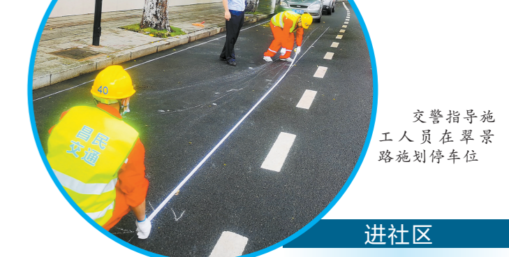
交警指导施工人员在翠景路划停车位

针对中小师生、家长,举办了“高新区中小师生交通安全知识竞赛”“香洲区文明交通手语表演赛”等活动,在全市范围内向各中小学校派发交通安全手册2万份。针对西部农村地区交通参