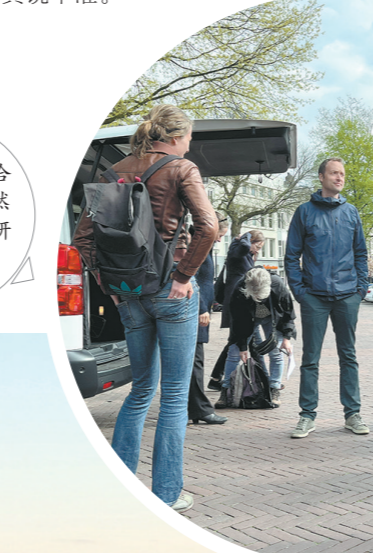
哥本哈根大学自然科学院研究小组师生