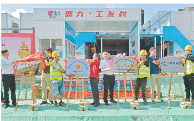
揭牌仪式现场

当天项目工地还开展了“夏送清凉·关爱工人”活动,龙岗区住建局工会主席、区建筑行业工会联合会常务副主席魏鑫率“慰问组”一行深入一线,慰问奋战在高温下的建筑工人们,给他们送上夏季防暑降温用品和饮料。(李蔚 古震华 杨智强 唐永国)