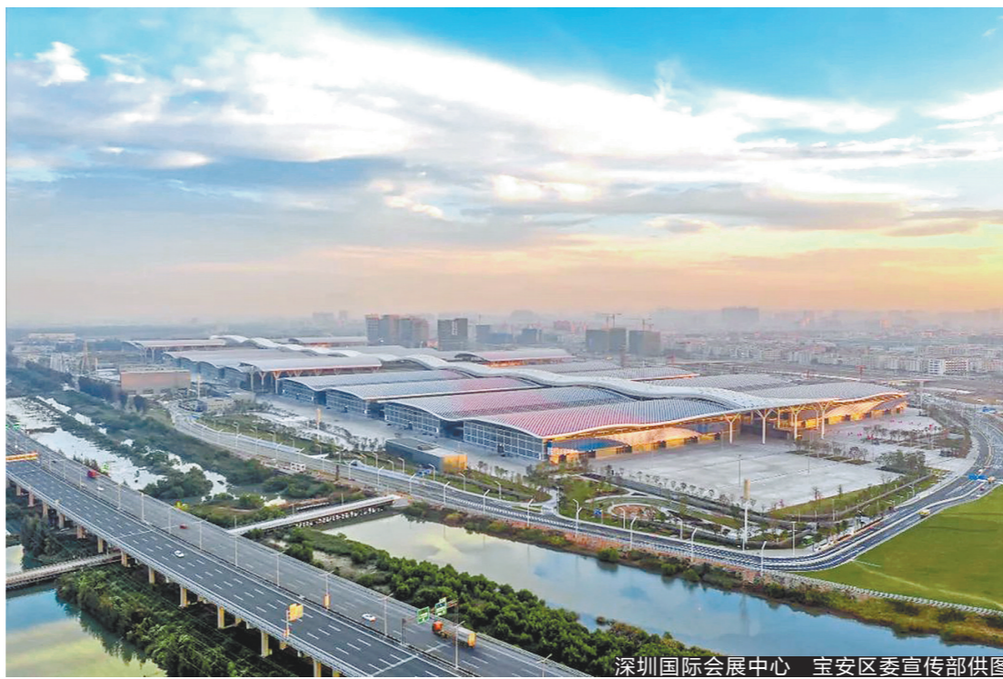
深圳国际会展中心