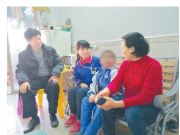
坪山街道关工委支持和帮助青少年健康成长

近年来,坪山街道关工委通过“金秋助学”“五老结对帮扶”“关爱明天扶困助学”等五老关爱活动,累计帮扶困难学生1065人,发放助学金97万元,慰