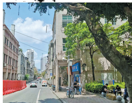
南华中路骑楼群