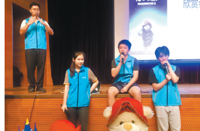
口述电影通常由2-3人接力完成