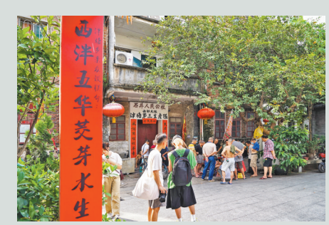
泮塘五约仍保留着一些重要的历史印记