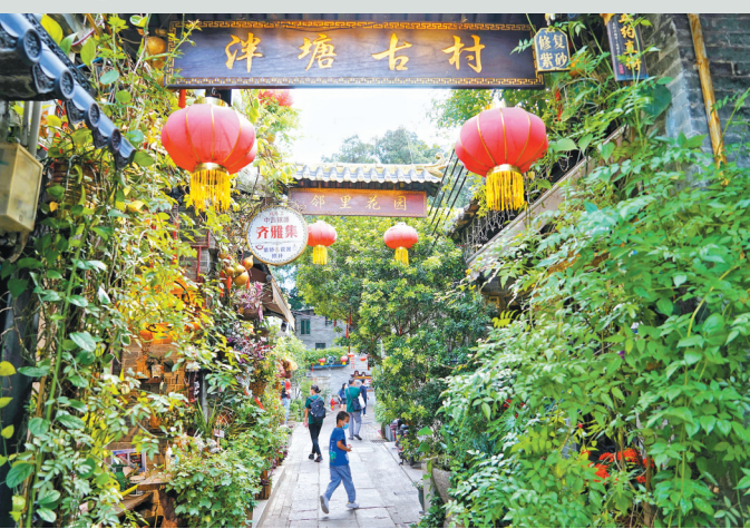
泮塘古村有九百多年历史

在此次更新中，文化的活化和产业导入是很重要的。悠长的古巷里，你会不经意间看到隐藏在其中的新青年艺术创意工作室、传统文化展示交流空间以及茶艺香道、木雕玉雕等各类艺术家、匠人工作室。周日下午，在位于泮塘五约直街上一家低调的漆器工作室里，独立大漆艺术家黄