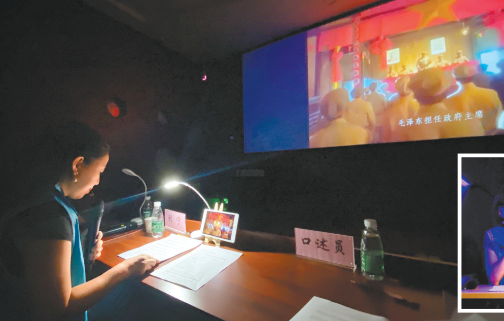
口述员以“声”为“眼”还原电影画面

对于视障人士而言，口述员的声音，就是他们在黑暗中发现艺术与生活动之美。随着口述员们将电影一帧帧画面的内容娓娓道来，视障观众以“声”为“眼”，时而微笑，时而皱眉，感受声音里的戏如人生。