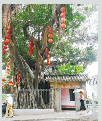
大榕树下的半溪五约亭被完好保留下来

经历了泮塘五约从破败到焕新的过程，政府统一更新公共空间，他们家则自己出资装修了一栋3层高的老房子，而今他们家一层做车库，一层居住，一层做天台农场，家人对现在的生活状态感到满足。