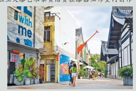
更新后的泮塘五约带着浓浓的文化气息