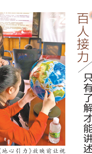
电影《地心引力》放映前让视障儿童提前感知地球表面

自2018年星辰社口述第一部电影《摔跤吧爸爸》以来，现在星辰社的成员已逾百人，超过半数的成员有了口述电影经历。