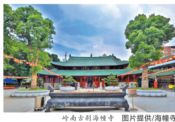
岭南古刹海幢寺