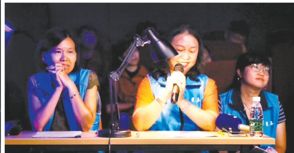
用声音传递电影里的快乐忧愁