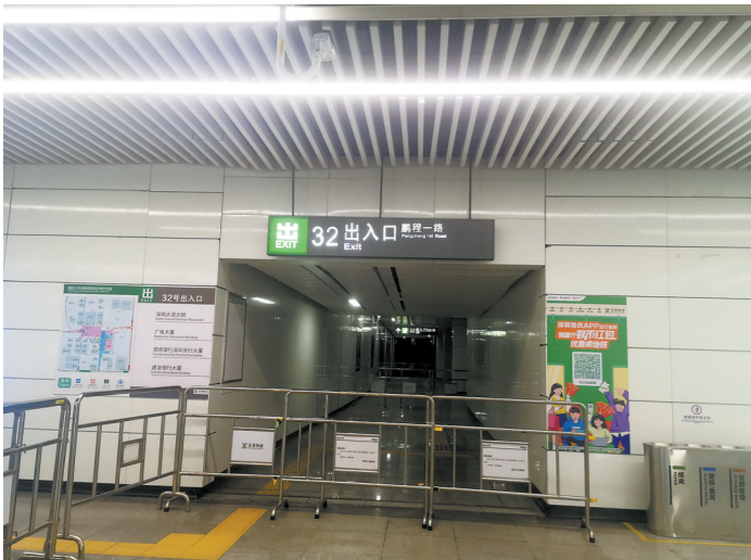
32号出入口尚未开放

工程方案不稳定。针对深圳市人大代表的要求，广深港公司表示，将克服困难，加快北端空间方案的实施，力争早日开通北端空间，具体措施包括：一、加快北端商业开发方案研究，稳定开发利用方案；二、及时把利用方案报深圳市轨道办，请求轨道办帮助协调规划、消防等部门进行审查，方案通过后加快细化落实；三、积极响应市人大代表及市民的需求，优先安排出入口及通道的施工，优先开通通行功能。