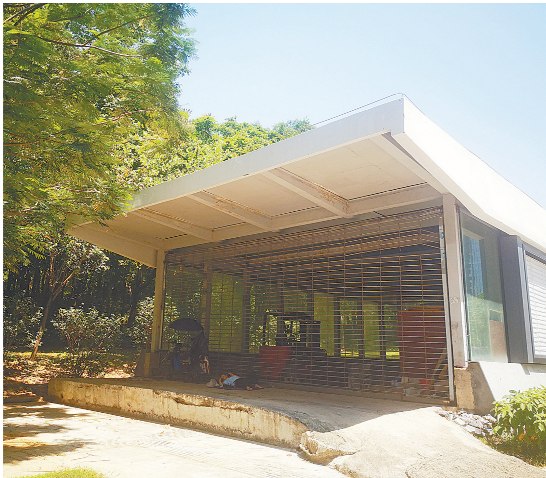
未开放的19号出入口

据了解，福田站开通始于2010年12月28日。当日，深圳地铁迎来里程碑时刻，地铁2号线、3号线同日开通运营，福田地铁站正式启用。2015年12月30日，广深港高铁福田站开通运营。2016年6月28日，深圳地铁11号线开通运营，设有福田站。至此，福田交通枢纽中心囊括了深圳地铁2号线、3号线、11号线和福田高铁站，形成一个深圳市接轨功能齐全的综合交通枢纽。从现场的福田站位置图可以看出，福田站总体位于深南大道和益田路十字路口的地下空间，共设有32个数字号的出入口，部分出入口设有“a、b”口，总计38个出入口，围绕“十”字形依次分布。“17-27出口”则分布在益田路北两侧，东侧为市民中心，西侧则为基金大厦、太平金融大厦、荣超商务中心等人流密集区。