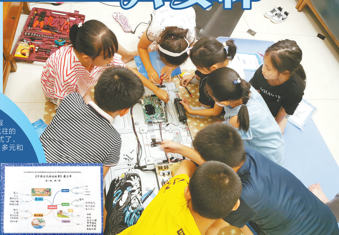
省实荔湾一小二4班电视机小组的同学在探究电视机内部构造

“双减”一周年。这个暑假，不少学校的暑假作业大变样——不再是以往的抄抄写写和天天做题模式了，取而代之的是更加有趣、多元和跨学科的探究式学习。记者在采访中了解到，大部分学校都布置了阅读的任务，此外，学校还鼓励学生多出去走走。读万卷书，行万里路，回归生活，解决实际生活中的问题，这些都成为这个暑假的主题。学生和家长们纷纷点赞这样的暑假作业，他们直呼，“双减”让暑假真正回归，也让教育返璞归真。