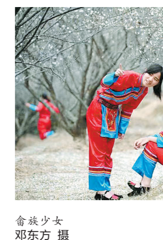
畲族少女

横河镇相关负责人介绍,接下来,当地将继续支持嶂背畲族村文化发展,发掘畲族文化资源,传承和培植畲族文化;以畲族文化为亮点,结合镇民宿旅游特色,打造嶂背畲族村民族特色旅游产业;通过发展嶂背畲族村民族特色旅游产业,带动嶂背畲族村村集体收入发展,助力乡村振兴。