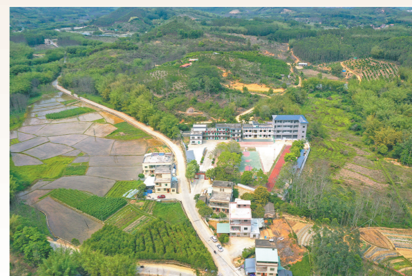
嶂背畲族村四周青山环绕,生态环境好