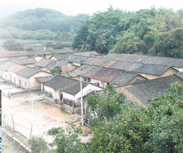
嶂背畲族村大板田小组保留着古屋