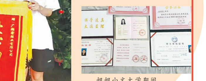
姐姐小文大学期间多次获得国家助学金