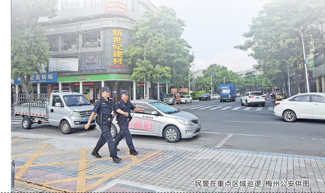
民警在重点区域巡逻

会议通报,“百日行动”开展以来,梅州全市公安机关坚持以打开路、打防并举、源头治理、综合施策,坚持整体防控和重点治乱,全面落实打、防、管、治各项工作措施,依法严厉打击各类违法犯罪,有效整治突出治安问题。 据统计,6月22日至8月11日,梅州全市刑事案件立案数同比下降12.3%、破案数同比上升27.8%;自主开展8次集中统一行动,无缝对接省公安厅周末夜查行动,推动梅州全市刑事、治安警情分别同比下降13.3%、18.3%。