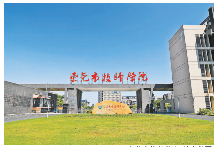
东莞市技师学院

“庆泰模式”是技师学院校企合作探索的成功范例,是“校企双制班”的一种形式,因最初是和东莞庆泰电线电缆有限公司合作开展而得名,其最大特点和亮点在于学生在校学习期间,企业就按月提供800-1000元生活补贴,在实习期间,按工作岗位要求与企业员工同工同酬,若学生毕业后留企,企业还给予一定的留岗奖励,学生集体与企业无缝对接为一体,实现了真正意义上的“进校即进企”。这种做法从2014年开始,越来越受多家企业欢迎。截至目前,技师学院已与68家企业共开办134个校企双制班,培养校企双制学