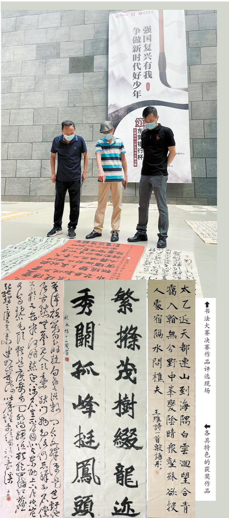
书法大赛决赛作品评选现场