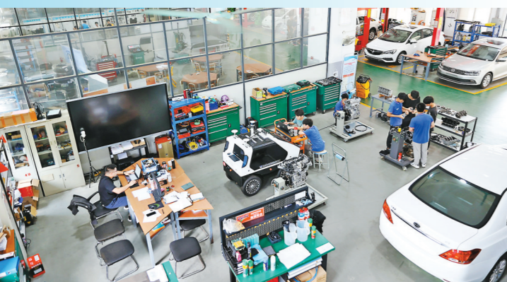
学生在学院实训场所进行实操训练

得益于坚持多年开展形式多样的校企合作,东莞市技师学院的毕业生踏入职场就可独当一面,与企业岗位无缝对接。因此,该校毕业生深受企业欢迎,受到用人单位高薪抢聘。相关统计数据显示,近三年,东莞市技师学院毕业生就业率达到了99.05%,就业对口率为96.85%,优质就业率为95.13%,用人单位满意度为95%以上。办学三十多年来,该校共为社会培养了近5万名毕业生,大多数已走上了各行业的管理岗位和技术岗位。