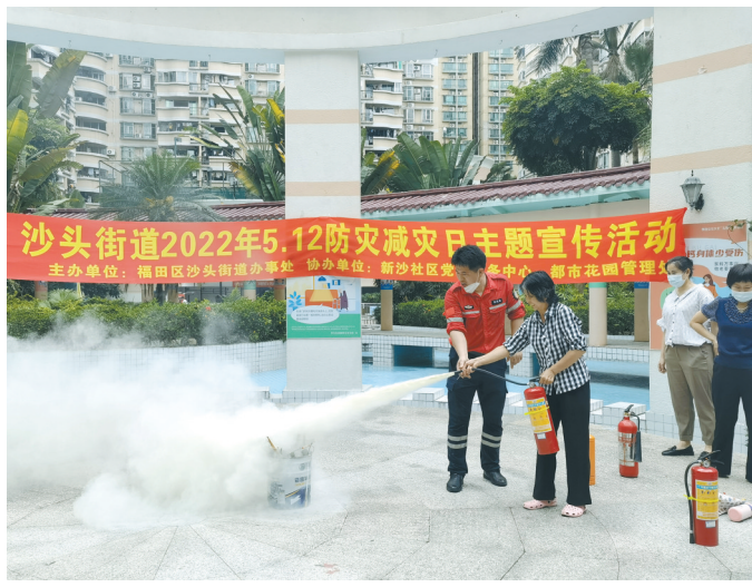
社区开展全国防灾减灾日主题宣传活动

如何进一步开展综合减灾社区创建工作？深圳不断探索、总结。9月1日起，深圳地方标准《综合减灾社区创建指南》(以下简称《指南》)正式实施。该《指南》由深圳市应急管理局、福田区应急管理局等单位牵头制定，明确13条综合减灾社区创建工作要求，为开展综合减灾社区创建工作提供指导。今年8月份，该《指南》被国家标准化管理委员会列入第八批社会管理和公共服务综合标准化试点项目。