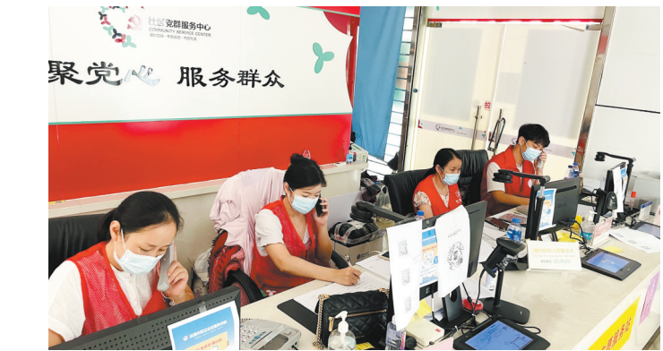
工作人员接听布吉暖心热线

为快速收集居民生活需求、解答疑难，在街道及17个社区共开通25条24小时暖心服务热线，并在“龙岗发布”公众号公布热线号码，每天安排三个班次、每班不少于2名党员志愿者、义工专门接听，在高中风险区域所在的社区设