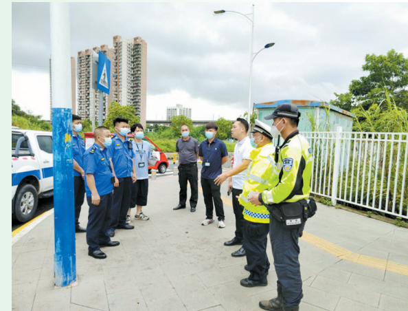
现场办公，提升辖区道路交通环境

“感谢街道和交警部门解决了长期困扰我们的出行问题，周边道路治理好了，我们出行就更有安全感了！”住在坪山区坑梓街道金沙社区锦绣华庭家园的居民对整治后的周边道路环境赞不绝口。自8月以来，坪山区坑梓街道坚持以问题为导向，坚持“靶向诊疗、标本兼治、综合施策”，着力提升辖区道路交通环境，进一步织密筑牢交通安全防护网，全面助力全国文明城市创建。