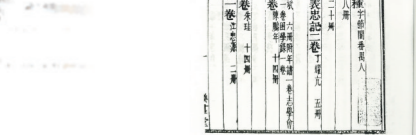
丰湖书院重修后，古韵十足 丰湖书院藏目录(部分,翻印版)