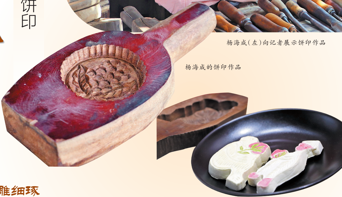
用饼印制作的猴子抱桃饼