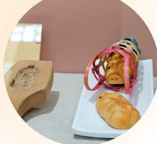
猪笼饼印及猪笼饼

猪笼饼，顾名思义就是把形似小猪的饼装在小竹笼里，又称“猪仔饼”，是旧时广东人在中秋节时送给小朋友的传统食品。在物质匮乏的时期，并非家家吃得上月饼。饼店工人将做月饼剩下的月饼皮，搓成小份面团，放到炉中测试温度，这就是猪笼饼的原型。后来，为了求好彩头，这些素面团便被做成了多子多福的猪仔造型，把猪仔放到竹编小笼子里，在笼子外面系上彩带。然后，将这些猪笼饼低价卖给百姓。小孩子拿着猪仔饼既可以当玩具，又可解馋。久而久之，中秋吃猪笼饼，便成定俗，猪笼饼在上世纪八十年代曾风靡一时。