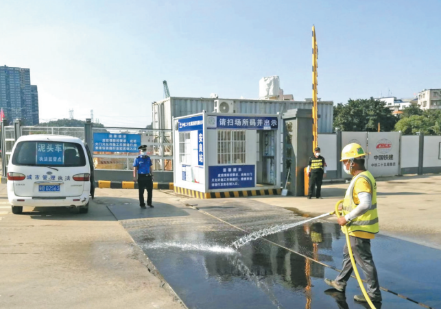
园山执法队加强对土方工地的执法整治

日前,龙岗区园山街道聚焦民生痛点,狠抓环境难点,通过源头治理和综合治理,重拳出击,持续开展扬尘污染专项整治,初步遏制扬尘污染“居高不下”的势头。 截至目前,已排查各类泥头车5368辆,查办车身不洁、车厢挂泥案件91宗;排查各类建筑工地803次,查办未采取防止粉尘污染措施、无专人冲洗清理、车辆带泥污染道路等案件43宗。 据悉,近年来,园山街道建设项目众多,各类施工的“叠加”造成扬尘污染日趋严重。该街道综合行政执法队一方面围绕土方流转的“泥头”和“泥尾”,狠抓污染源头治理。城建办、执法队加强了对辖区各类建筑工地的日常管理,建立政