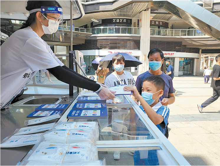
大鹏“防疫号”在宣传

据大鹏办事处相关工作负责人介绍,此前为助力深圳市争创首届全国文明典范城市,大鹏办事处利用“文明号”宣传车向市民宣传创文知识,当前,疫情防控正处于关键阶段,所以将其变身防疫宣传车,宣传车的优