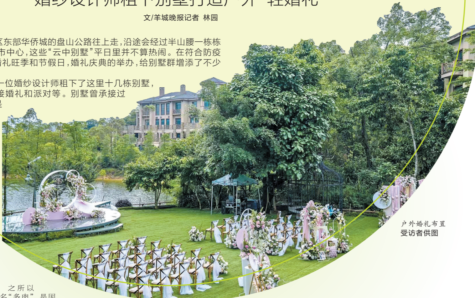
户外婚礼布置

据了解，三年前，一位婚纱设计师租下了这里十几栋别墅，创办“多肉花园”，承接婚礼和派对等。别墅曾承接过最小型的户外婚礼，是从北京打“飞的”过来的客户，总共六个人——新人加上双方父母，在蓝天碧水间，举办了一场梦幻而难忘的婚礼。