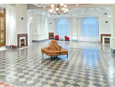
建筑首层空间开阔明亮

全国重点文物A类保护建筑——法国东方汇理银行旧址坐落于沙面一街3号，它的身影曾定格在无数人的照片中。百年流逝，历经20多年的荒废，走过4年的修缮历程……法国东方汇理银行旧址已完成修缮，即将局部开放，而它的背后有着一段曲折的修复故事。