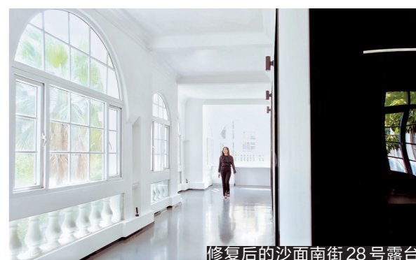
修复后的沙面南街28号露台

人文气息。 广东省文物保护委员会委员、广州大学建筑与城市规划学院教授汤国华表示，文物建筑的修缮、活化，重在保持它的真实性、完整性，修复时要遵循最小干预与可逆性原则，不但要以科学态度、绣花功夫利用好文物建筑、历史建筑，也要做好周边环境的保育。在活化与利用中，令文物建筑群焕发文化新活力，这也是城市软实力的体现。