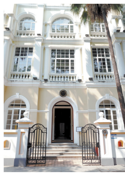
沙面南街28号(合筑·中法建筑文化交流中心)

洒满阳光的午后，一群建筑设计师现身合筑·中法建筑文化交流中心的露台，一场有关过去和未来的思想沙龙悄然上演着，更多未完待续的故事在沙面南街28号发生。