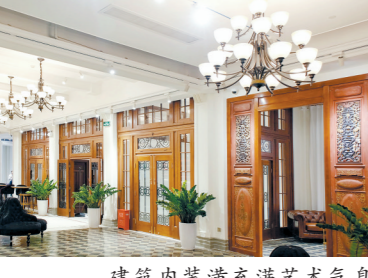
建筑内装潢充满艺术气息