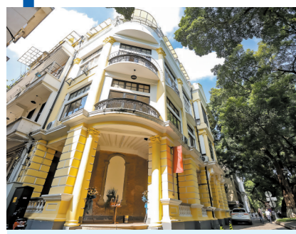
沙面大街39号建筑具有西方新古典主义风格

沙面大街39号，一座百年建筑，同时也是一个坐标。从最初的沙面洋行，到后来的法国传教社。在漫长的历史中，不同的人曾在此经营或居住，建筑的样貌随着诸多因素发生着变化，这一坐标的内涵也随着流转变迁。现在，它以咖啡馆的形式融入现代生活，向市民开放，成为人们体验沙面文物建筑人文精神的新途径。