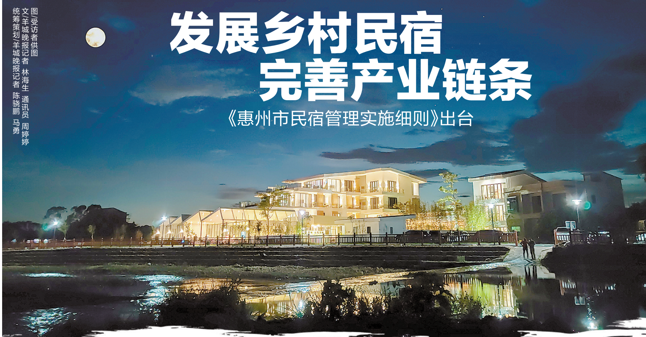
充满乡村气息的惠州民宿