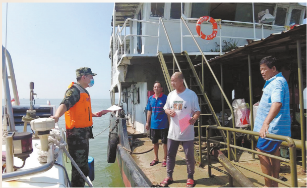
深圳海警局工作人员提醒船员注意台风影响