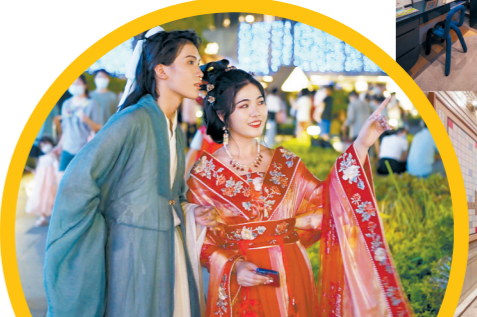
云门NEW PARK成新“打卡点”