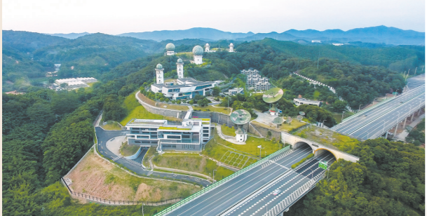
广州气象卫星地面站天鹿湖站