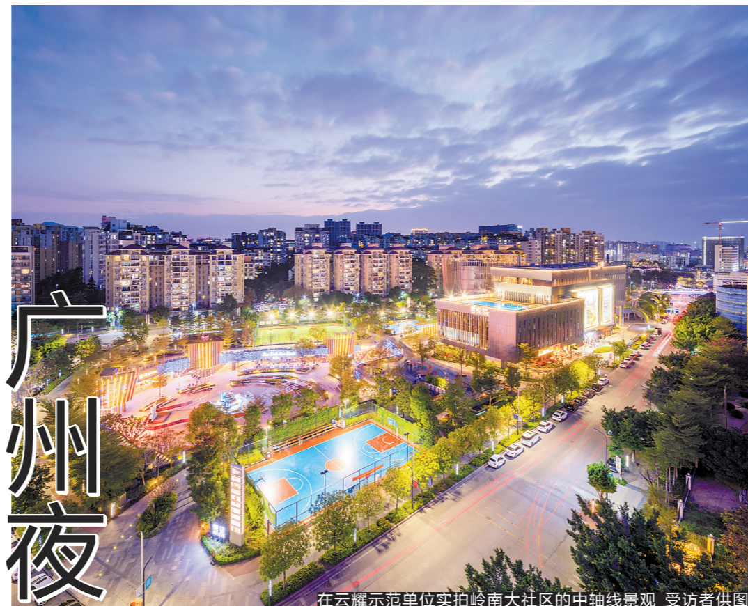
在云耀示范单位实拍岭南大社区的中轴线景观

有能力逆市拿地,正是新世界财务稳健的重要表现,而这种资金实力给业主带来坚守交付的承诺,更是房企给消费者最温暖的信心保证。新世界旗下物业的业主再购率超过一半,有业主反映,其中一个重要原因是新世界稳健的开发理念及超强运营实力,让人更放心、更安心,这在当下的市场环境显得尤为重要。