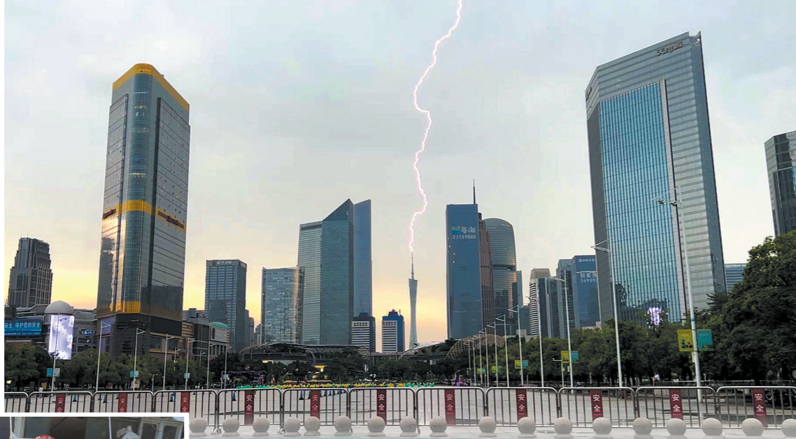
广州塔引雷技术,减少周边建筑的雷击风险