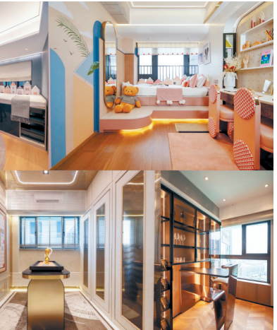
云耀的户型和交楼都根据买家的需求经过多次打磨