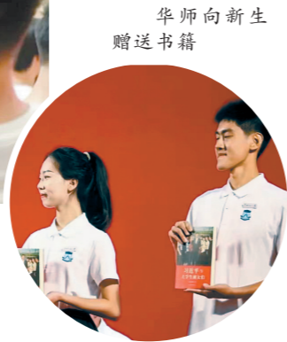
华师向新生赠送书籍

业专科学校校史考(1910-1952)》两本书作为入学礼赠送给新生，希望“新华工人”能够在喜迎二十大和学校组建70周年暨办学105年的历史交汇点，谨记习近平总书记对青年人的关心、关注和关爱，传承好华工百年来的红色血脉。