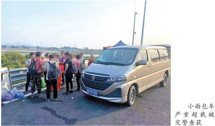
小面包车严重超载被交警查获

眼下,珠海交警正在开展夏季突出交通违法行为专项整治百日行动,珠海交警警告广大司机,车辆超员是非常严重的交通违法行为,一旦发生事故,车上人员很可能被抛出车外,极易造成多人伤亡的交通事故。