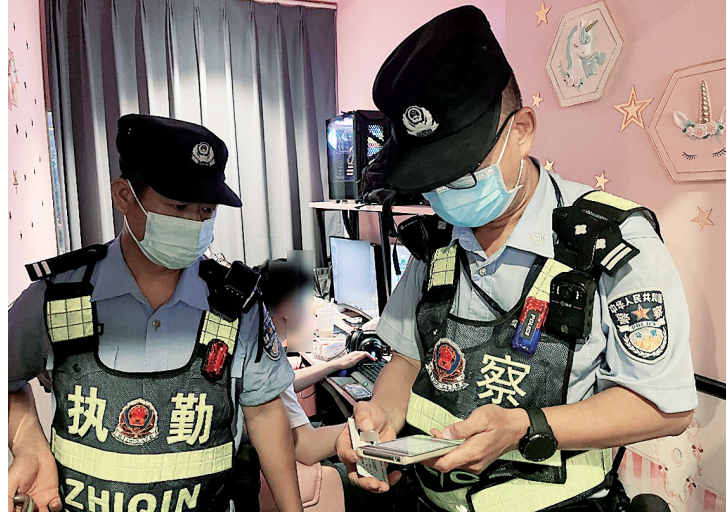
开展集中清查统一行动

此外,行动中珠海市公安局还打掉涉养老诈骗犯罪团伙3个,抓获犯罪嫌疑人37名,冻结资金13万元,查封价值1700余万元房产1套,动员犯罪嫌疑人主动退赃1.4万元。