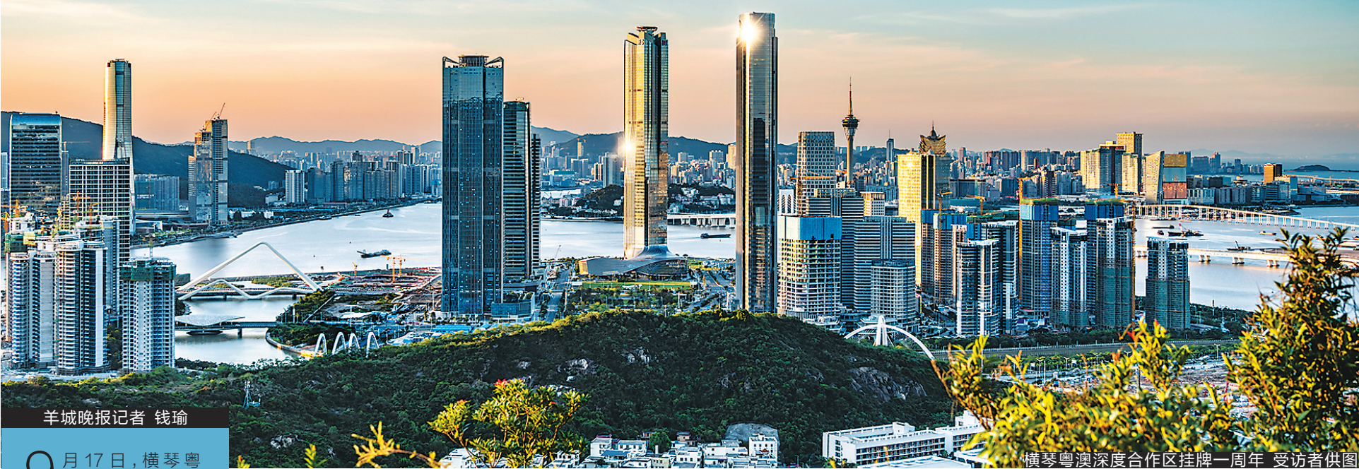
羊城晚报记者 钱瑜