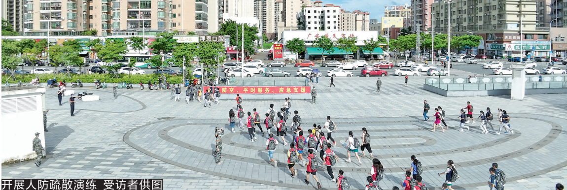
开展人防疏散演练

9月17日,珠海市成功牵头组织“珠三角天盾-2022”城市人民防空协同演习暨珠海市第22次防空警报试鸣活动。珠海市委常委、常务副市长杨川,珠海警备区副司令员朱景洲等领导及20个相关成员单位负责人全程参与并指挥演习和试鸣。