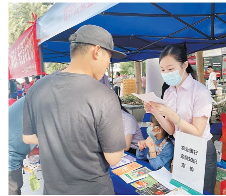
中国农业银行展位开展金融知识有奖问答活动

此外,中国移动东莞分公司也在现场进行互动,提供手机卡和宽带办理咨询等服务,提醒居民出借、买卖手机卡可能构成犯罪。