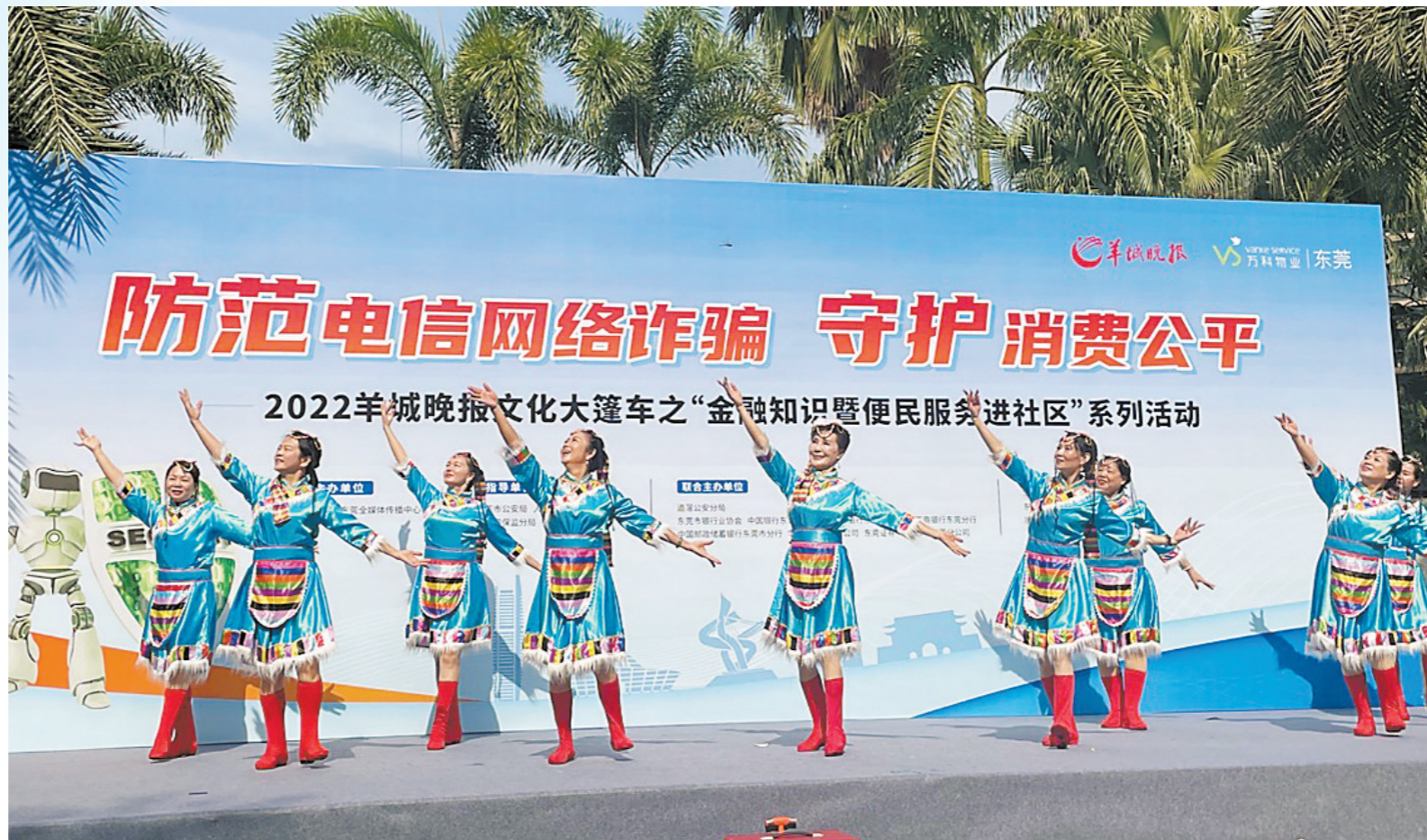
在道滘活动现场,业主上台表演才艺

系列活动10月29日启动后,陆续在黄江富康花园、道滘沿海丽水佳园、万江盛世华南、大岭山中惠沁林山庄以及常平万科城举办。主办方通过通俗易懂、有趣的形式向消费者广泛宣传电信网络诈骗的最新形式以及相关金融知识,提升消费者对电信网络诈骗的识别能力及防范能力。