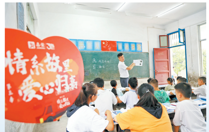
嘉荣外国语学校老师为河南文昌村学生义教