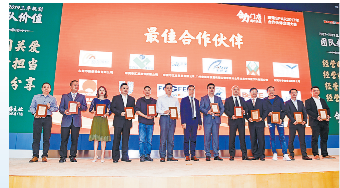
三十年来,嘉荣与社会各界携手同行

经过一年的建设发展,嘉荣外国语学校、尚城学校无论是校舍校貌,还是硬件设备、师资力量与课程改革等,都已升级优化,焕然一新,成为高质量民办学校,为东莞教育高质量发展再添新力量。