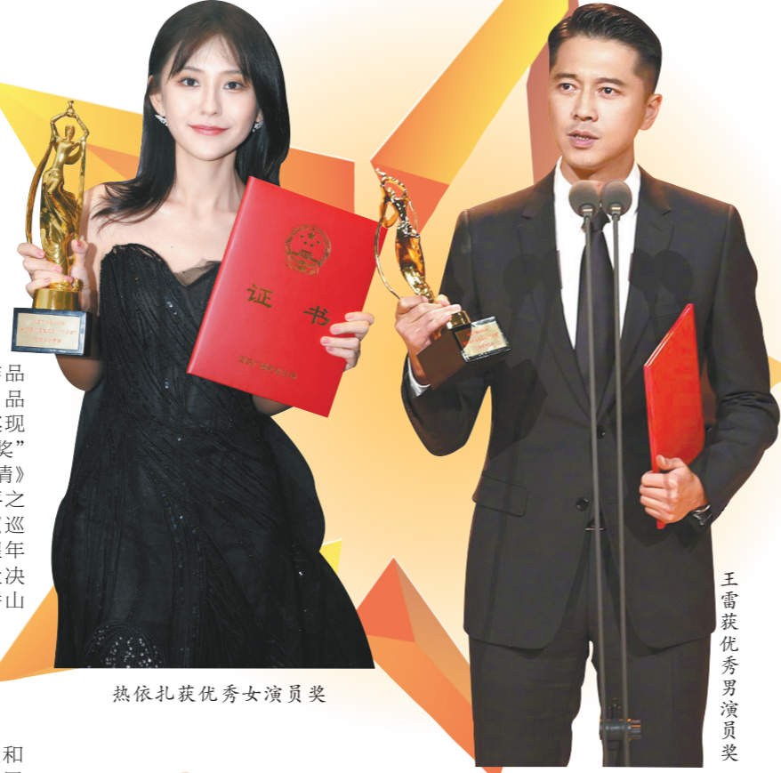
热依扎获优秀女演员奖

第33届电视剧“飞天奖”、第27届电视文艺“星光奖”颁奖典礼11月1日晚在京举行。当晚，最受关注的演员类奖项优秀女演员奖和优秀男演员奖分别由《山海情》的热依扎和《功勋》的王雷夺得。