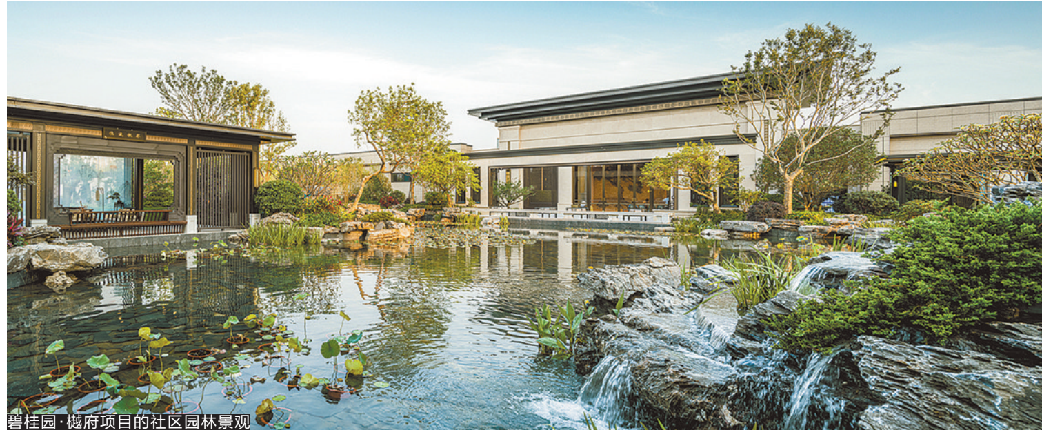
碧桂园·樾府项目的社区园林景观

自开盘以来多次占据月度销售榜单,这与其坐拥江景资源,并结合天然优势打造多重园林景观有不可分割的因素。据介绍,该项目将滨河景观融入场地,通过多维立体园林景观让水景、连廊等区域,呈现出丰富变化、连续又有层次感的效果,连廊两侧又衔接着建筑、滨河、树影、叠水等景观,提供给业主高品质居住体验场景。