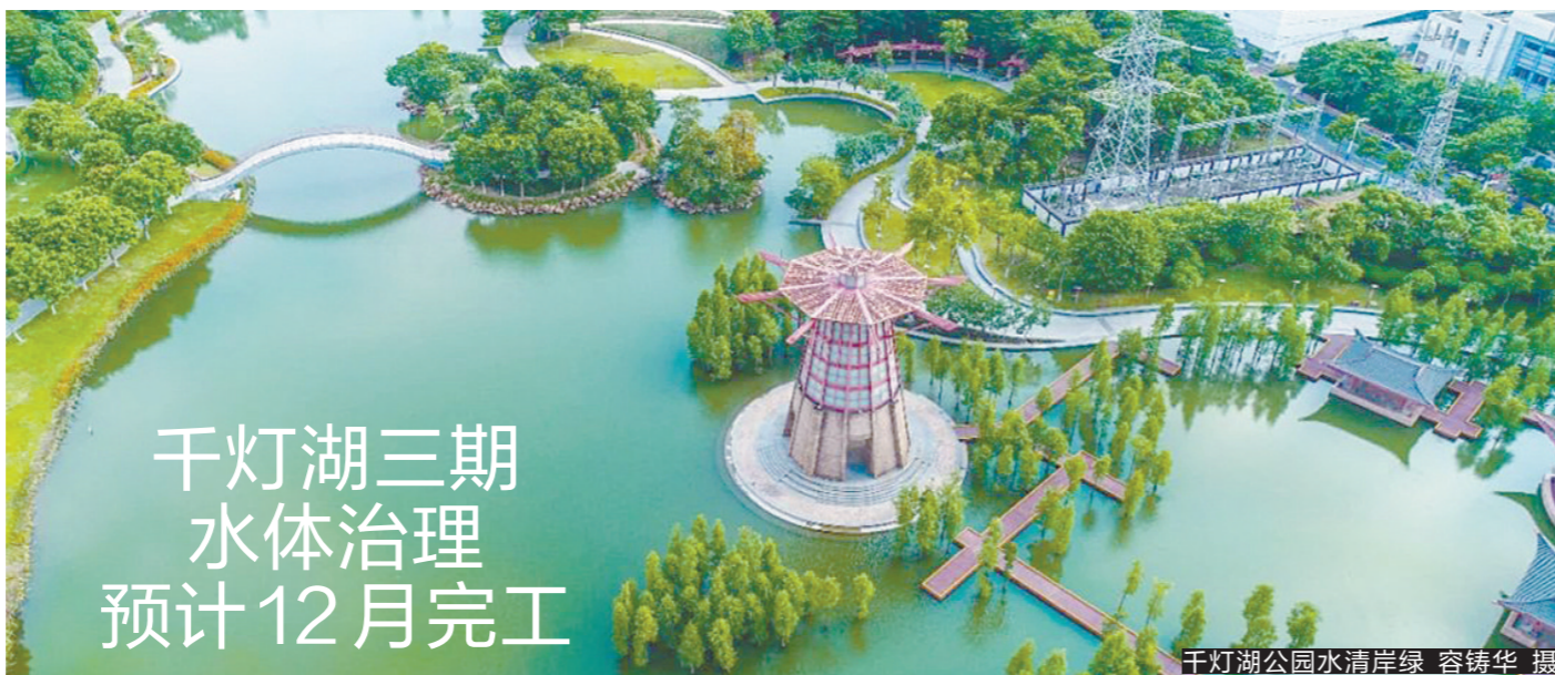
千灯湖三期 水体治理 预计12月完工