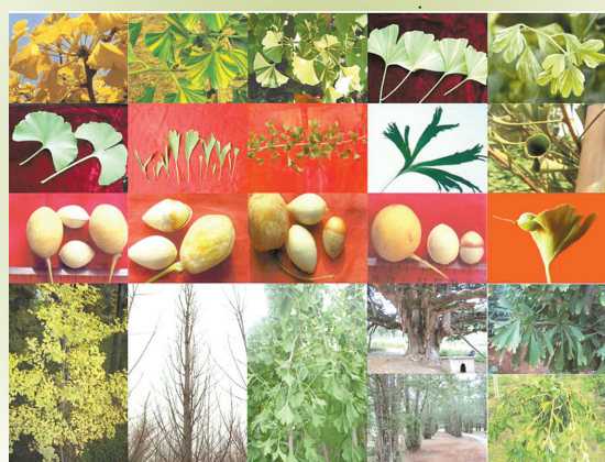
多彩多样的银杏品种

虽然目前针对银杏长寿的分子生物学研究还不是很深,但相信随着林木生物技术的不间断进步,对银杏长寿的机制必将会有更精彩的解读。