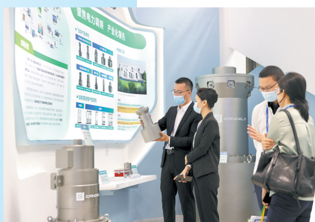
高交会上商家展示高科技产品