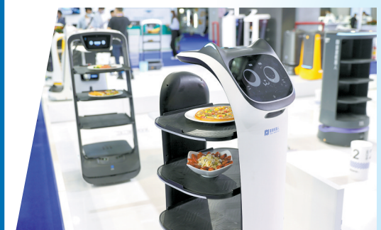
高交会上AI机器人应用场景越来越丰富