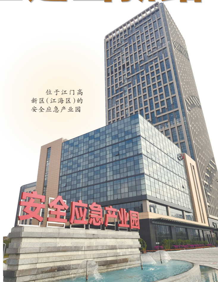
位于江门高新区（江海区）的安全应急产业园

作为承载安全应急产业落地的载体，位于江门高新区（江海区）核心区域的江门市安全应急产业“版图”日益扩大。记者了解到，产业园内“安全应急产业总部+孵化基地”“产业加速器+产业基地”三大功能区同步