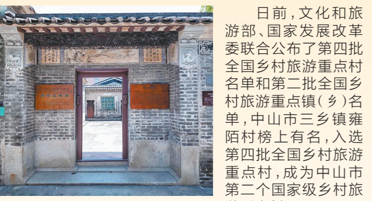
郑观应故居