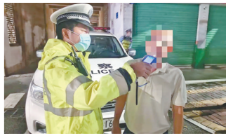
交警对司机进行酒精测试

珠海交警部门相关负责人表示，世界杯开赛以来，珠海交警天天查酒驾，每天持续到下半夜，请各位司机文明观赛切勿酒后开车。(文/图 何叶舟 李静)