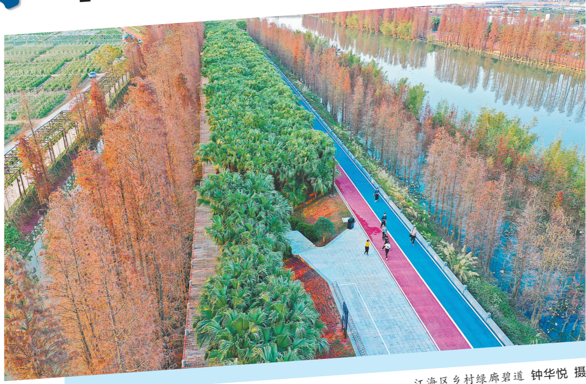
江海区乡村绿廊碧道

据了解，全面推行河湖长制以来，江门市坚持把碧道建设作为乡村振兴的重要抓手，将旅游、产业、人居环境整治等融入碧道建设中，以水系治理带动乡村全面振兴。