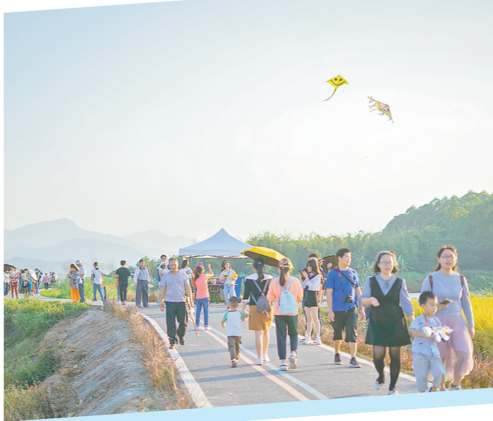
大塘村“两山”碧道游人如织

据了解，开平市水系连通及美丽乡村建设依托开平江重点支流治理项目和碧道建设工程开展。项目将镇海