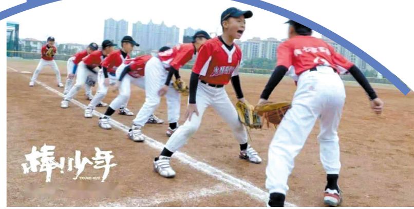
部分纪录电影海报资料图