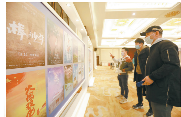
海报展现场