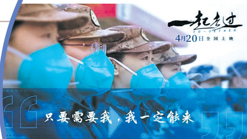
只要需要我，我一定能来

据悉，纪录电影主题海报展于12月12日至13日在珠海度假村酒店，12月14日在华发中演大剧院歌剧院，12月15日至31日在海韵城华发新天地C区中庭进行全天候展出。