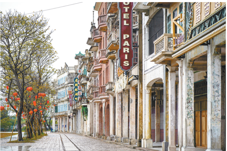
即将试运营的赤坎古镇华侨文化展示旅游项目街景

从民国三年(1914年)起，赤坎镇的长途运输由木帆船换成了电轮船。当年运营的电轮船每艘