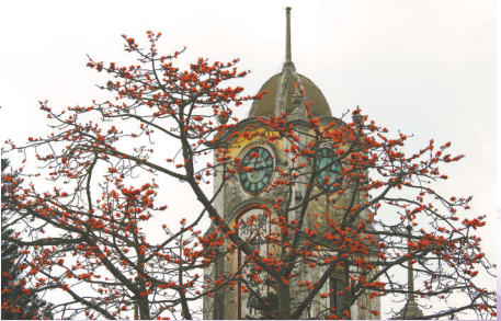
赤坎古镇，钟楼 春晚