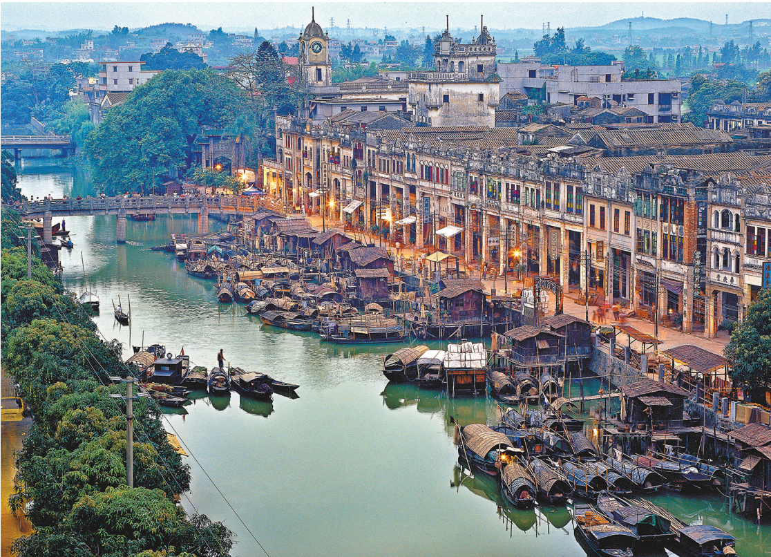
潭江河畔赤坎古镇，一派渔舟唱晚景象

19世纪中叶，五邑局势动荡，不少民众被迫出洋，前往世界各地谋生。赤坎潭江边的码头，正是不少华侨出洋的始发地。当地也由此成为著名的侨乡。司徒美堂、司徒璧如、关光宗、关文清等著名华侨均祖籍赤坎。直到如今，大部分本地居民都有海外亲属关系，祖籍赤坎的海外华侨及港澳台同胞多达9万余人。