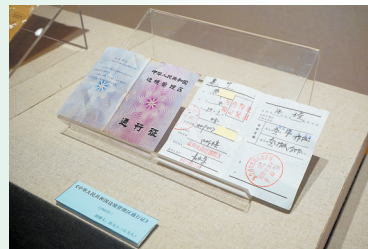
市民捐赠的展品

截至目前，线上线下已有约10万人次观展。展览原计划展出至12月20日，但顺应各方强烈要求，展期将延长至2023年2月19日。