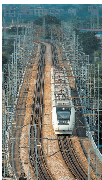
行驶在石龙的动车组

文振强还告诉记者，石龙火车站是典型的八角楼建筑，在没有高楼大厦的年代显得异常气派，站内站外热闹非凡，每天到发旅客有1万多人次。蒸汽动力火车年代，石龙火车站还是广九铁路中途唯一能加水的车站。“因地理优势，石龙火车站汇聚了东莞、