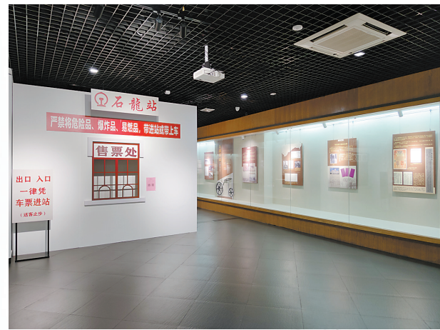
广九铁路111周年展怀旧打卡点

广九铁路与东莞石龙有着深厚的历史文化渊源，回首过往，岁月轮回中，这条铁路随着时光变迁而饱经沧桑。今年11月15日，《风雨广九家国路——广九铁路111周年展》在石龙开幕，这是迄今我国第一个全面展示广九铁路一个多世纪历史的专题展览，而石龙是该巡展在东莞的唯一一站。近日，记者实地走访广九铁路石龙段，探寻百年广九与古镇石龙的深厚历史文化渊源，讲述一条铁路与一座城的动人故事。