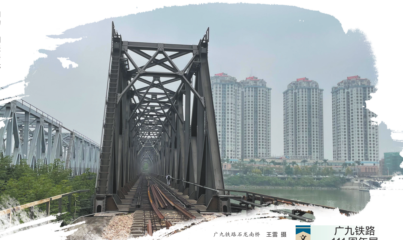
广九铁路石龙南桥